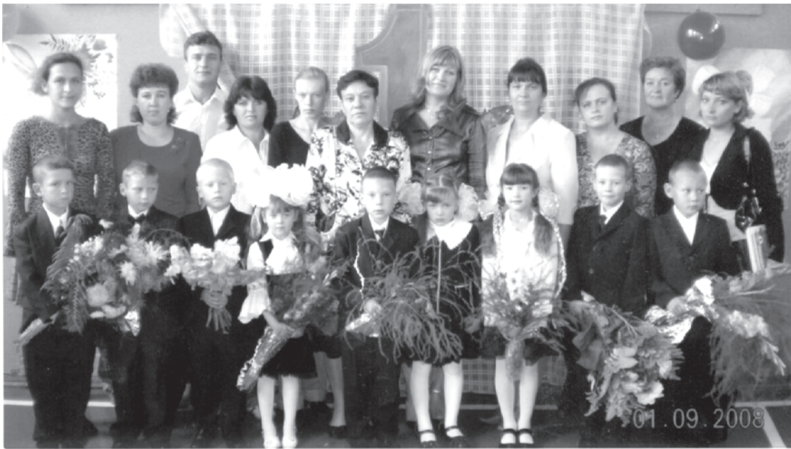
2008 г. Казаковская школа, 1 класс.