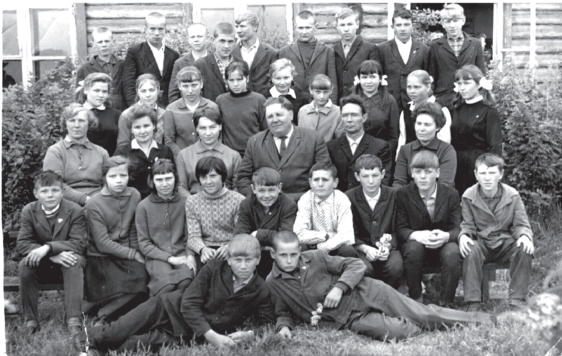
1968 г. Куяровская школа, 8-а класс.