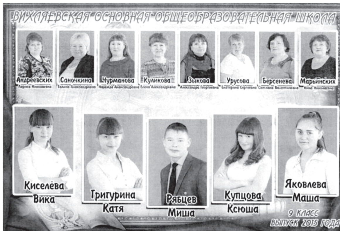
Вихляевская общеобразовательная школа. 9 класс, 2015 год.

Объявляя фотоконкурс «Одноклассники», мы даже не подозревали, что он найдёт такой большой отклик у наших читателей.