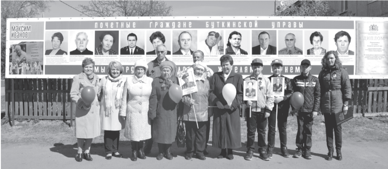
У мемориала почетным жителям

Выборы скоро. Кто-то агитки клеит, а кто-то серьезно работает.