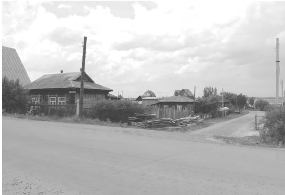
Пересечение улиц Ленина-Мичурина

После завершения строительно-монтажных работ к газу будут подключены десятки домов.