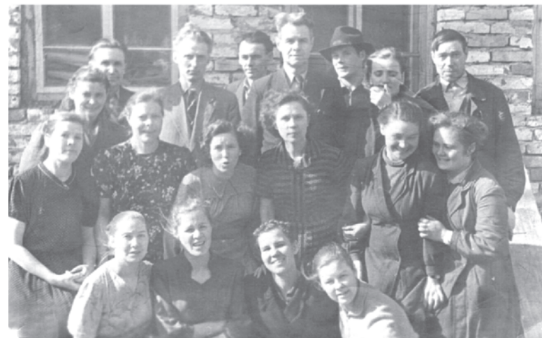
Сотрудники редакции и типографии. 1964 г.