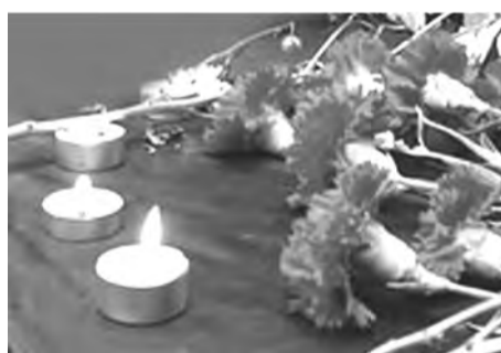
В ночь на 22 июня в Талицком ГО пройдет акция памяти, посвященная годовщине начала Великой Отечественной войны.

Уже традиционно главным местом проведения акции «Свеча памяти» стала плотина городского пруда возле пограничного столба со стороны Управления образования, по адресу: г. Талица, ул. Луначарского, 57.