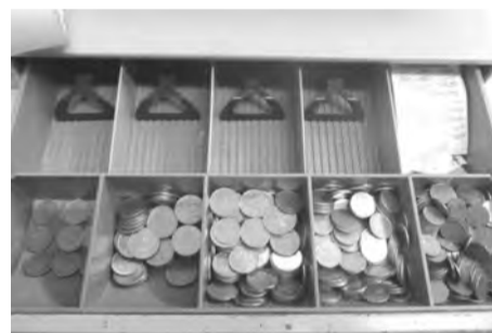
В селе Бутка подросток обокрал продуктовый магазин.

В дежурную часть полиции Талицы поступило сообщение от жительницы села Бутка о том, что в ночное время в помещении магазина проник неизвестный, который похитил денежные средства и другое имущество. Ущерб составил 15 тысяч рублей.