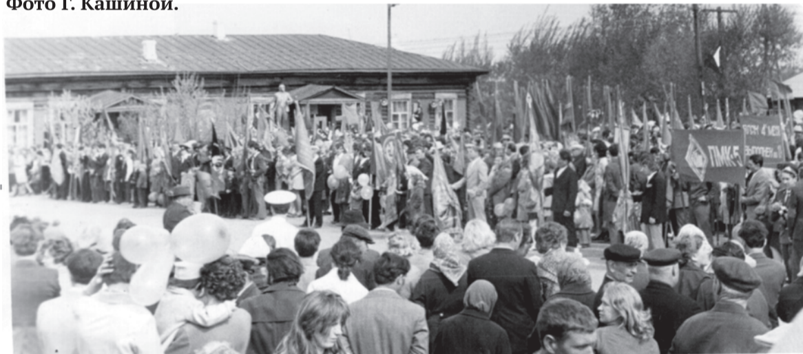
70-е годы. Митинг 9 Мая на площади в г. Талице.