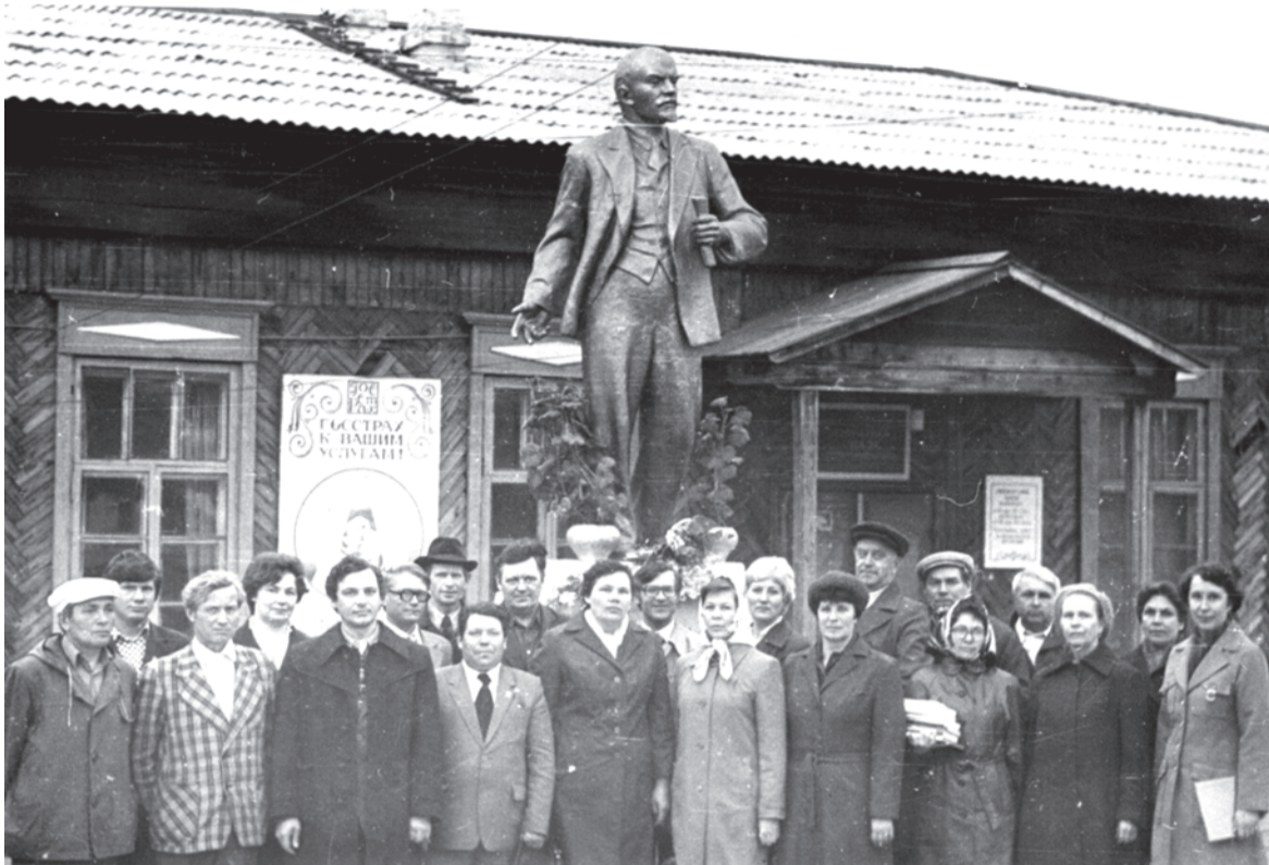
70-е годы. У здании Госстраха (бывшего Дома культуры) на площади в г.Талице.

тий, старых зданий, природных ландшафтов, а также групповые, одиночные или семейные портреты. Каждая фотография должна сопровождаться информацией о том, когда и где она сделана, что на ней изображено (или кто изображен), от кого получена.