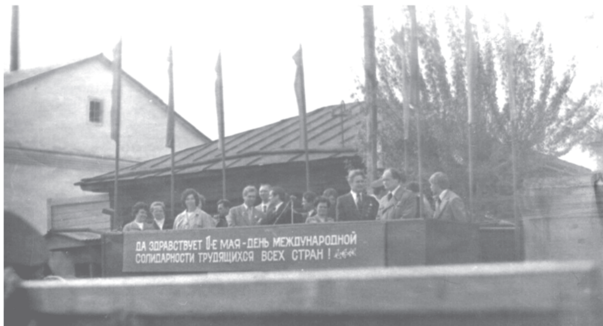
60-е годы. Митинг 1 Мая на центральной площади в г. Талице.