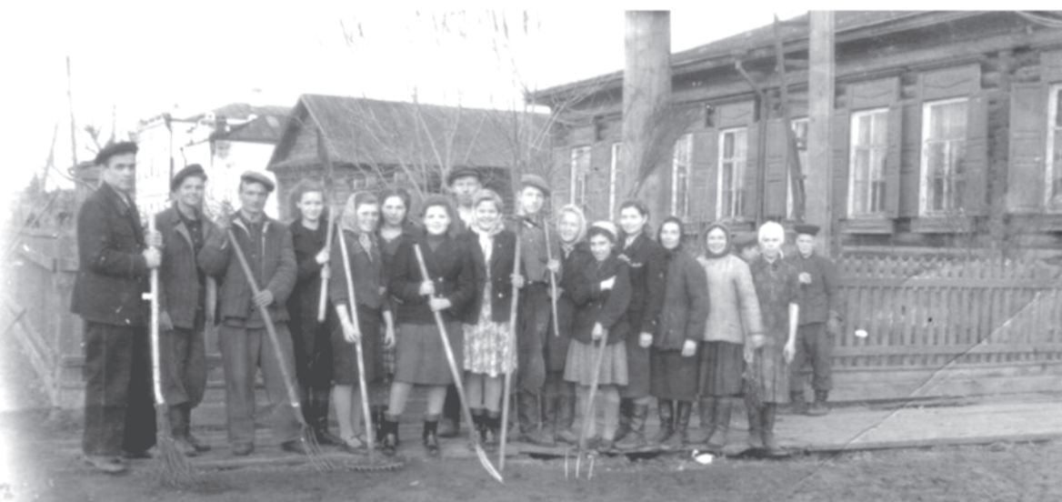
28.04.1949 г. г. Талица. Отделение связи на субботнике.