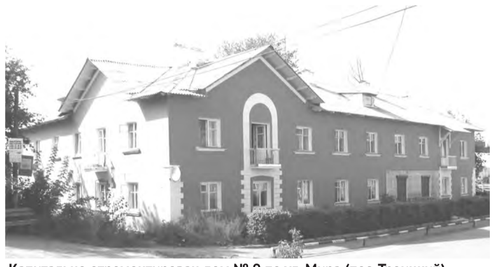
Капитально отремонтирован дом № 9 по ул. Мира (пос. Троицкий)

В этом отопительном сезоне запускается еще одна газовая котельная, построенная в микрорайоне Южный для нового детского сада. Мощность ее позволяет подключить многоквартирные дома с ул. Ромашковой, отапливающиеся до этого от старой угольной котельной. Сейчас люди