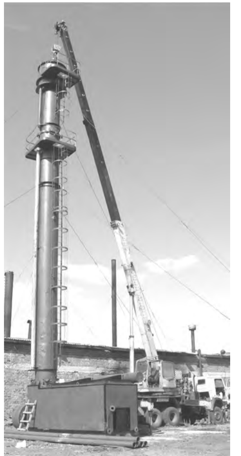
Вырос «Урал-котел» на ул. Луговой (пос. Троицкий)

- У нас в этом году на капитальном ремонте 7 домов в п. Троицком, хотя предварительно их было 16. Изменения произошли потому, что 6 домов в Пионерском оставили на дополнительное обследование, ряд домов за линией в п.Троицком сняли с ремонта потому, что ремонт там нецелесообразен. А вот на дома-красавцы, отремонтированные фирмой «Олимп» из п. Заречного (они выиграли аукцион), можно посмотреть. В домах по ул. Мира 9, 13, 15 сделаны не только фасады, но и крыши, и отопление, и канализация. В домах по ул. К. Маркса эта же фирма меняет отопление, электрику. До 15 сентября все работы по замене и ремонту тепловых сетей должны быть