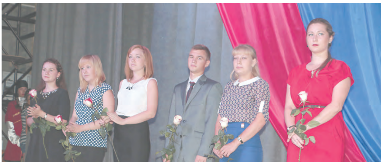
Молодые педагоги Талицкого ГО

Сегодня для более 8 тысяч учеников распахнут свои двери 26 образовательных учреждений Талицкого городского округа