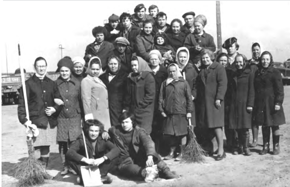
80-е годы. Ленинский коммунистический субботник в Талицком автопредприятии.

тий, старых зданий, природных ландшафтов, а также групповые, одиночные или семейные портреты. Каждая фотография должна сопровождаться информацией о том, когда и где она сделана, что на ней изображено (или кто изображен), от кого получена.