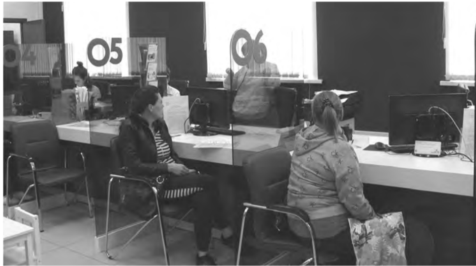
В операционном зале МФЦ пусто не бывает

Транспортного налога поступило (на 1 сентября 2016 года) 1 млн. 848 тыс. рублей, что на 57 процентов меньше прошлогоднего периода. В целом сумма исчисленного транспортного налога за 2015 год составляет 8 млн. 660 тыс. рублей. Количество физических лиц, подлежащих налоговому исчислению, составляет 3 134 человека. Количество льготников в этой сфере – 9 тыс. человек. Общий сбор составил 21 млн. рублей (в 2015 году), а задолженность составляет более 11 млн. рублей, в т.ч. транспортный налог – 6 млн., земельный – 3 млн., имущественный 2 млн. 300 тыс. С учетом того, что земельный и имущественный налоги идут на пополнение местной казны, то она недополучила более 5 млн.