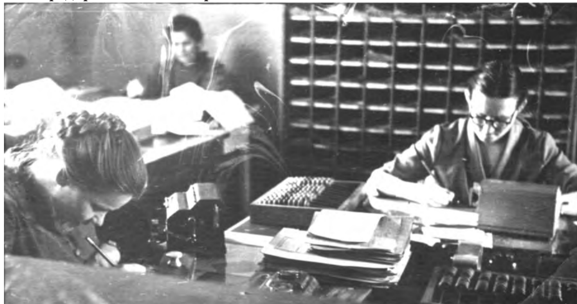
Вот такие счетные машинки были в конторе Талицкого автопредприятия в 1962 году.