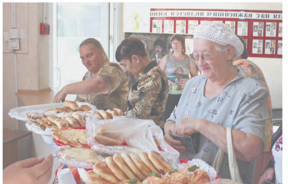
Вкусный сюрприз на Дне открытых дверей