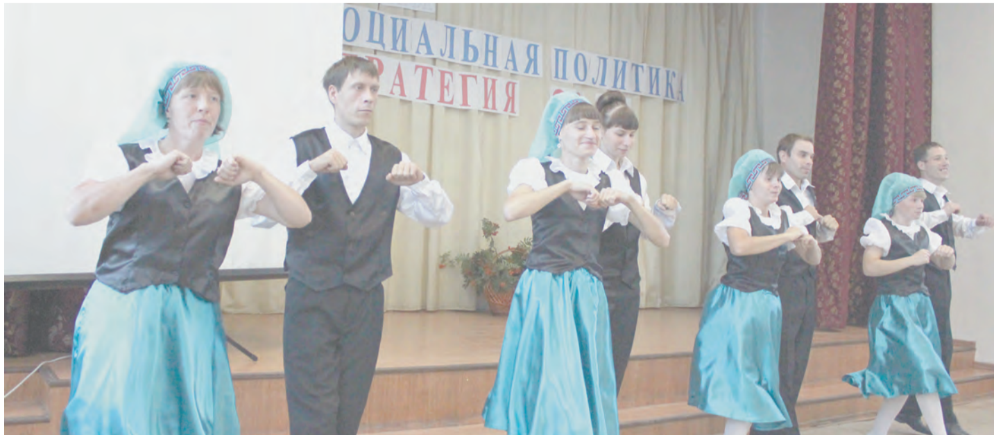
Танцевальный коллектив Талицкого пансионата для престарелых и инвалидов

Фойе было украшено кинолентой, где в каждом кадре отражены рабочие моменты управления социальной политики населения