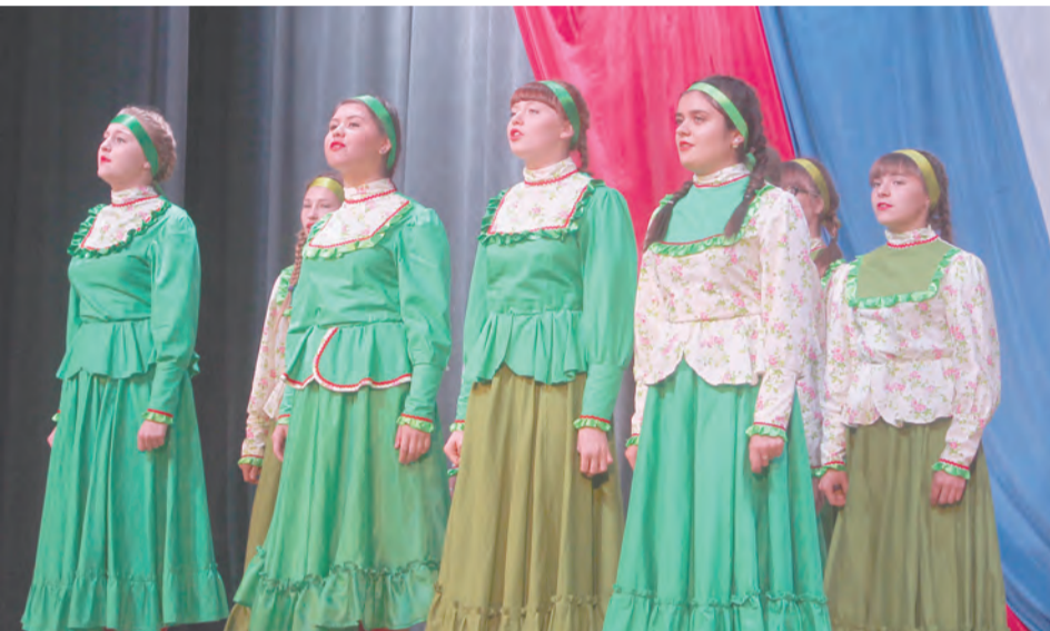
Детская обрядовая группа «Скоморошенки»

ности украинского национального костюма.