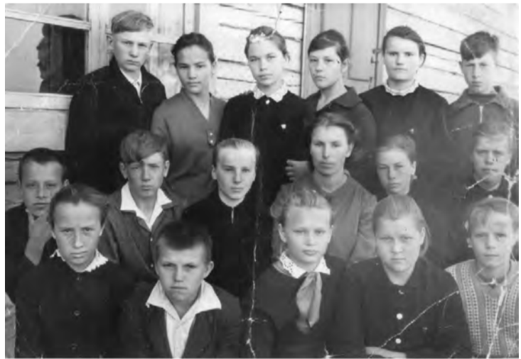
Завьяловская школа, 7 класс. Май 1965 г.