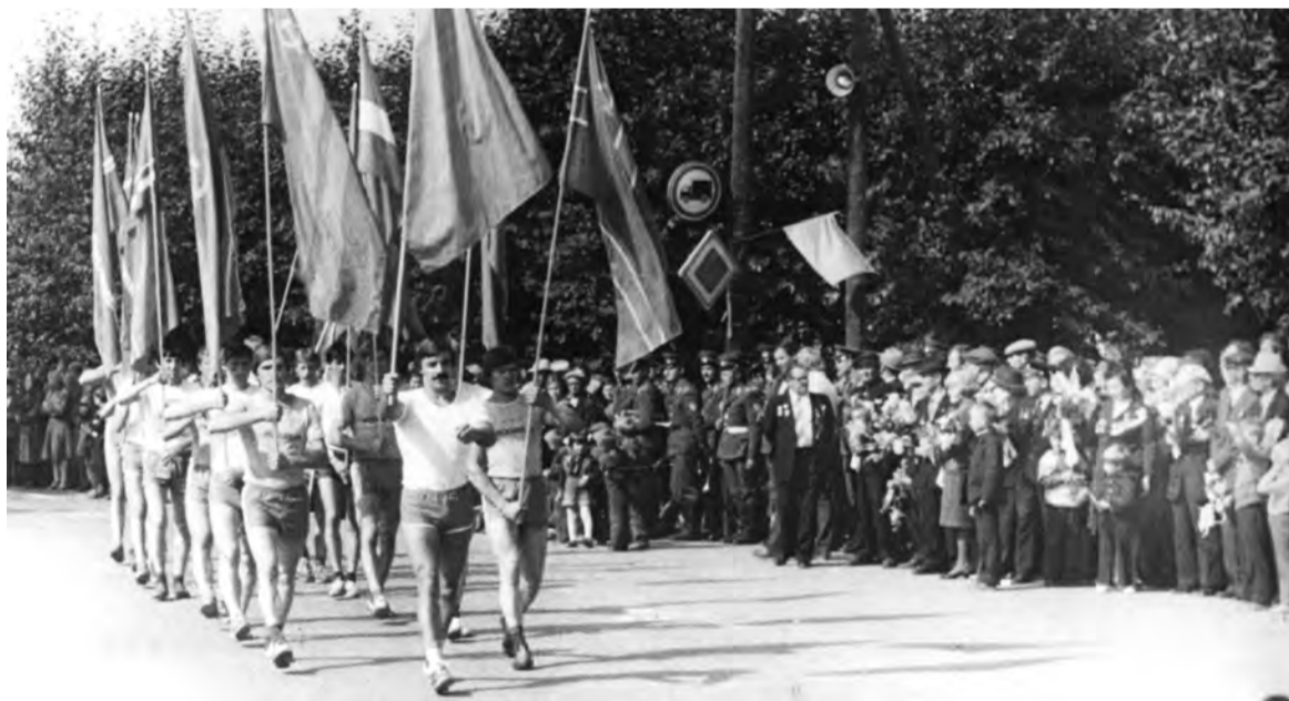
22 августа 1982 г. Талице - 250 лет.