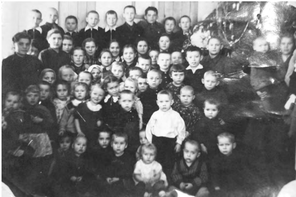
Новогодняя елка для детей в заготконторе. 1 января 1954 года.

тий, старых зданий, природных ландшафтов, а также групповые, одиночные или семейные портреты. Каждая фотография должна сопровождаться информацией о том, когда и где она сделана, что на ней изображено (или кто изображен), от кого получена.