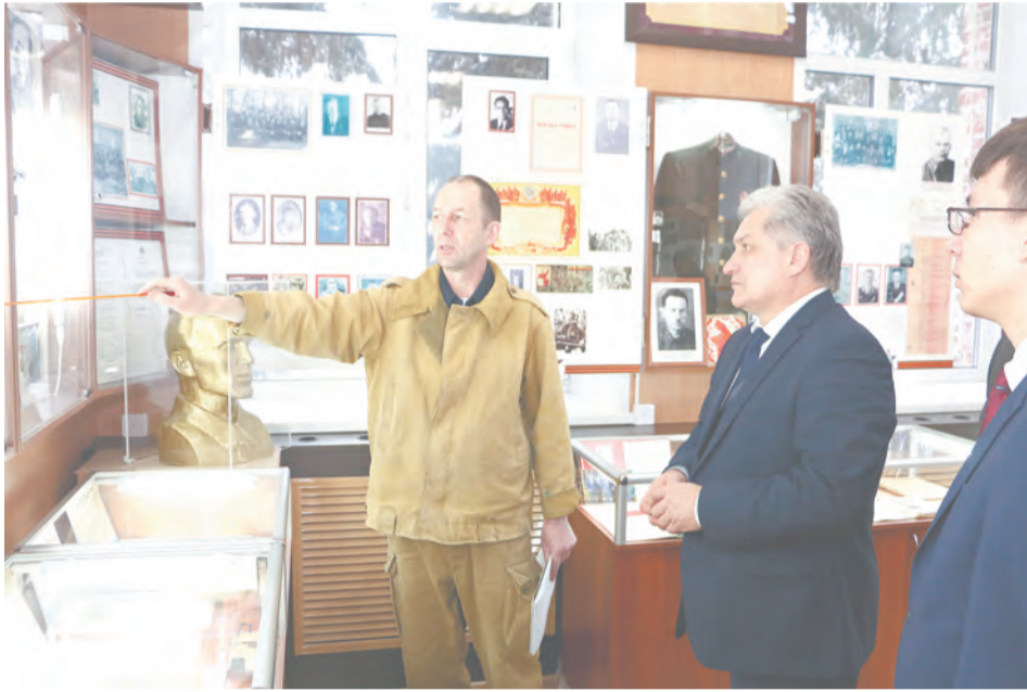
Экскурсия в музее ТЛК