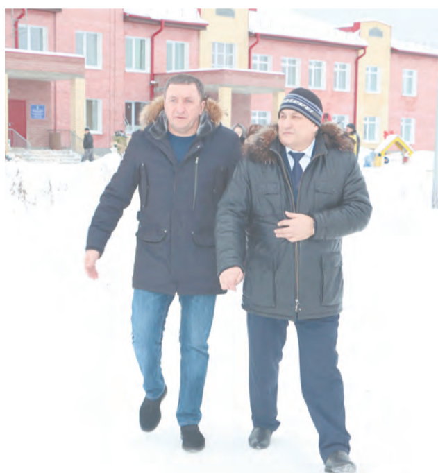
Детский сад в п. Троицком - до открытия считанные дни

21 января Талицкий ГО с рабочим визитом посетил Юрий Биктуганов, министр общего и профессионального образования Свердловской области. График поездки – насыщенный. Министр провел в Талице весь день и не ограничился приемом граждан по личным вопросам, он побывал на строительных площадках, успел пообщаться с руководителями образовательных учреждений, посетил школу искусств и осмотрел особняк Поклевских-Козелл.