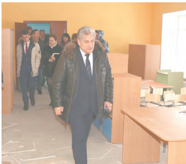
Мебель в д/саду должна отвечать санитарным требованиям