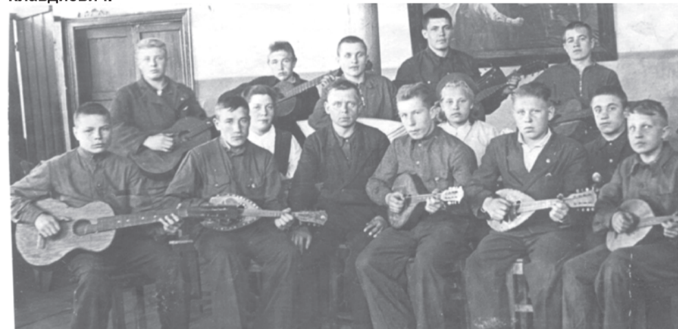
Струнный оркестр, из учащихся ФЗУ. 1949 год.