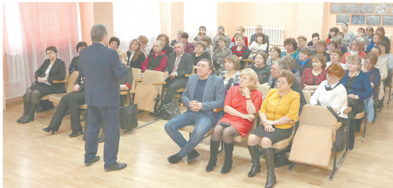
«Перед нами три задачи...» - министр провел лекцию для педагогов

педагога в систему? Ежегодно на обустройство и ведение хозяйства молодым специалистам выделяются так называемые «подъемные» деньги. Но этого недостаточно. Раньше была практика, когда выпускник ВУЗа, поступивший по целевому направлению, строго 3 года был обязан отработать на территории. Сейчас такого права нет. Министр предложил варианты поддержки. Во-первых,