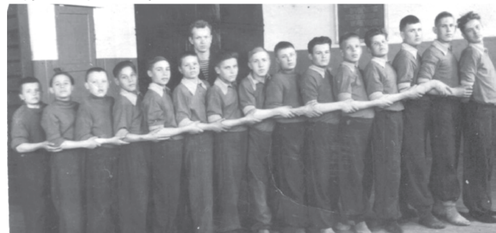
Сборная команда акробатов-пирамидчиков. Учащиеся ФЗУ. 1950 год.