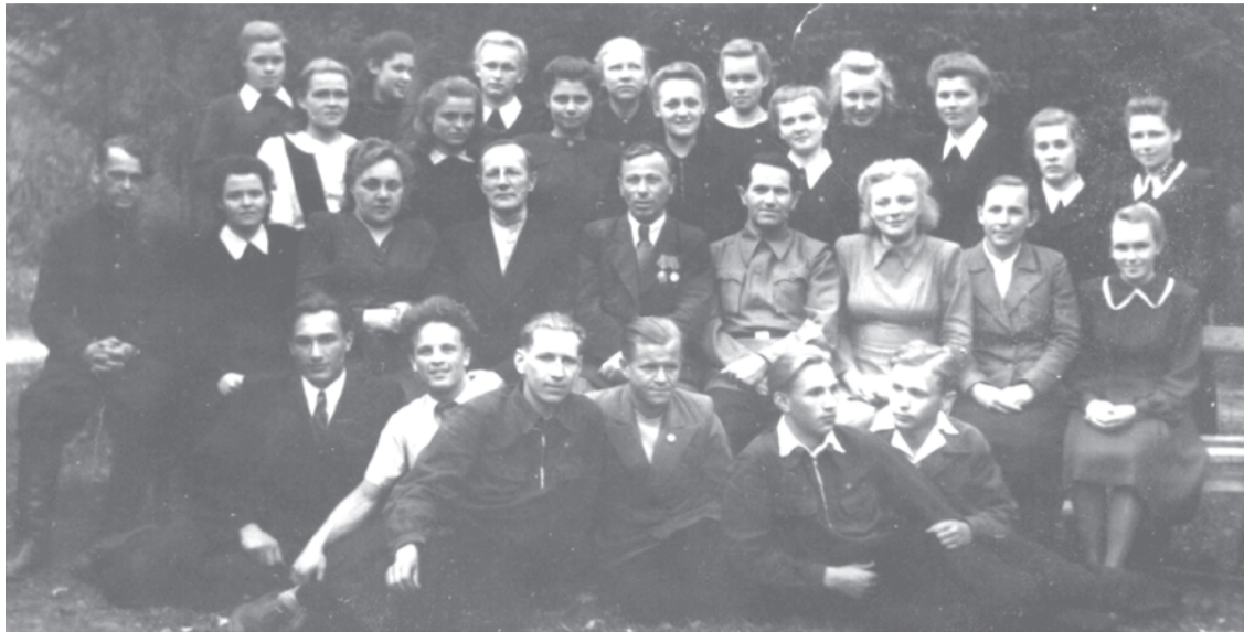
Май 1950 г. 14-й выпуск 10 класса Taliцкой средней школы. В этом году выпустилось 19 учащихся и все поступили в высшие учебные заведения. Преподаватели: Пономарева Л.М. (химия), Очков А.С., (зав. уч. частью, русский язык и литература), Ременик Е.И. (история), Жураховский Ф. В. (физика), Гмызина Г. Г. (немецкий язык), Данилова В. Д. (математика), Овчинников Б.И. (физкультура).