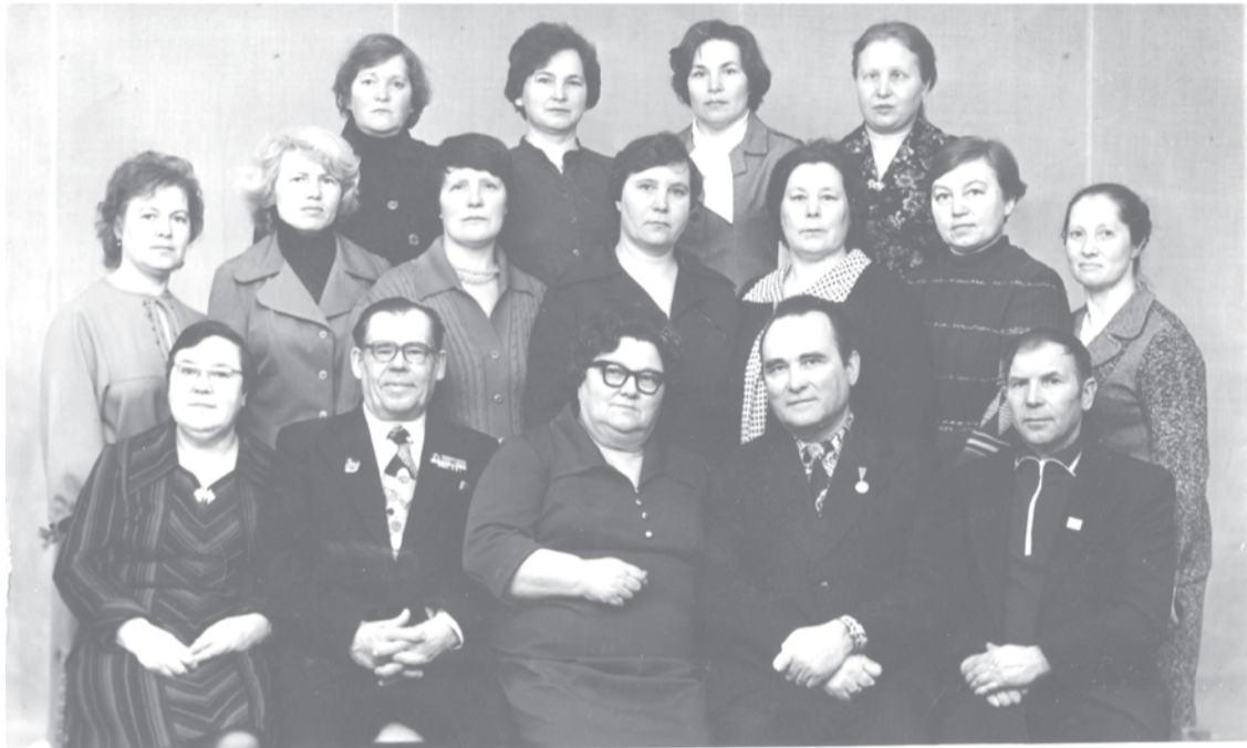
Выпускники Taliцкого педучилища, 1981 г. г.Талица. 1-й ряд преподаватели училища. Кл. руководитель Вельгус В.М., преподаватель русского языка и литературы.