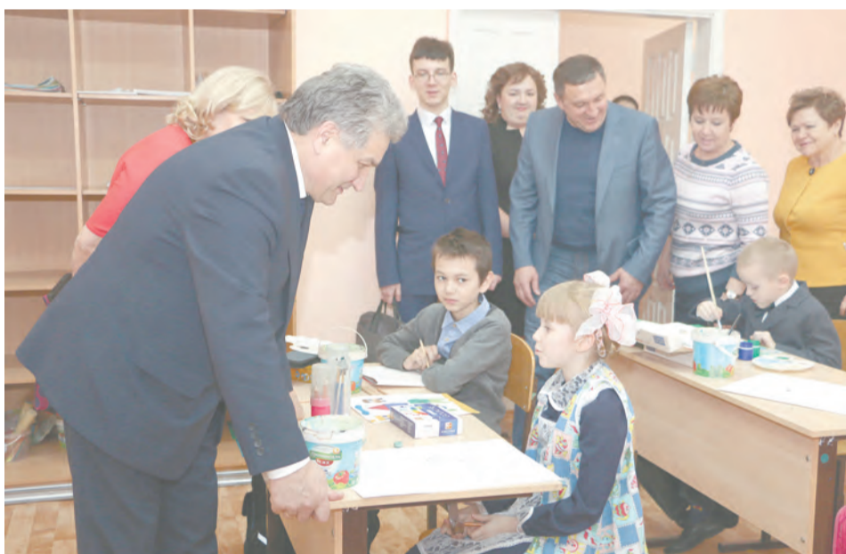
«Главное, чтобы для детей были созданы условия» - на уроке рисования в школе искусств

- Многие ученики пользуются гаджетами, и мы не можем им запретить приходить с ними в школу. Что делать?