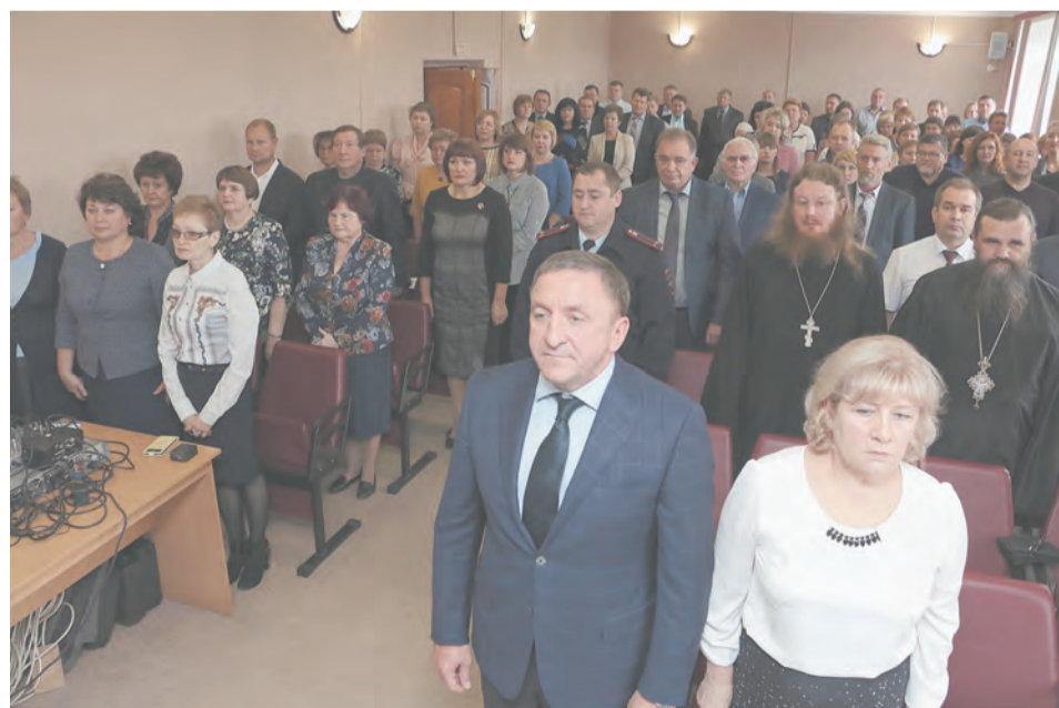
Это и для нас слова гимна РФ: «Славься, Отечество наше свободное...»

разу не разочаровался в его деловых и руководящих качествах.