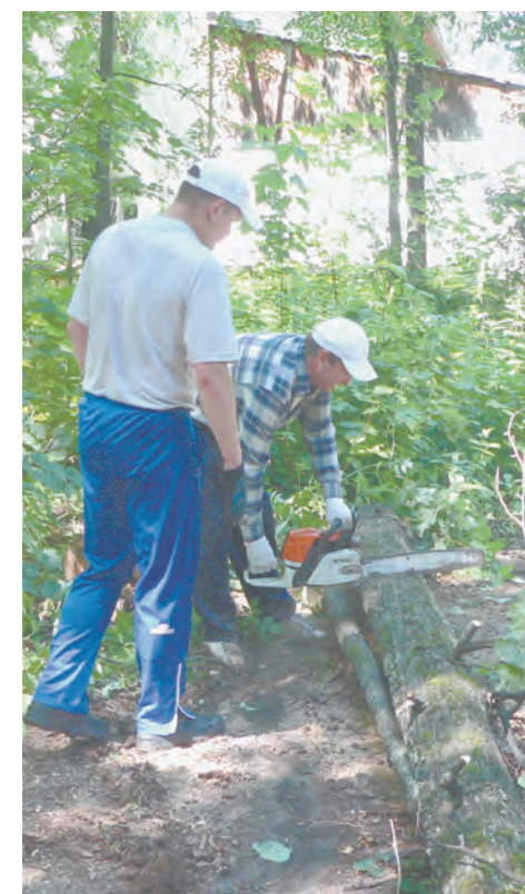
Субботник в парке-дендрарии