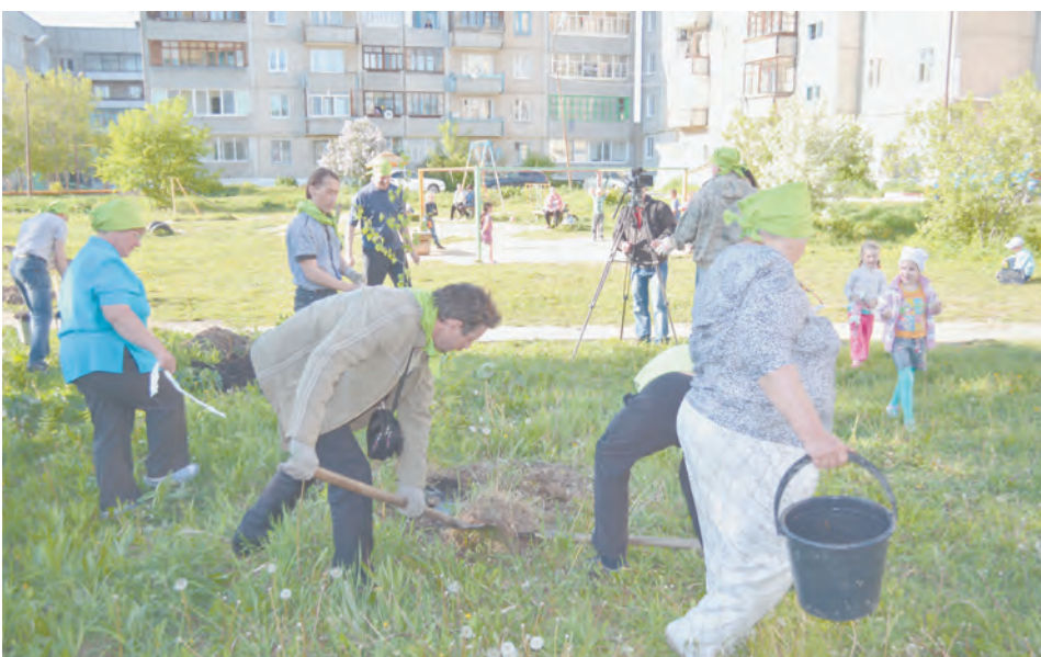
Луначарского, 8: общественники на посадке

Тяга к «мичуринскому» труду у Владимира с детства, хотя родители далеки были от