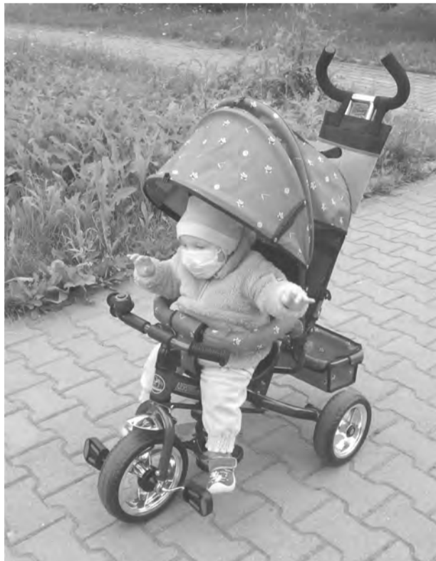
Фото из групп поддержки в социальных сетях.