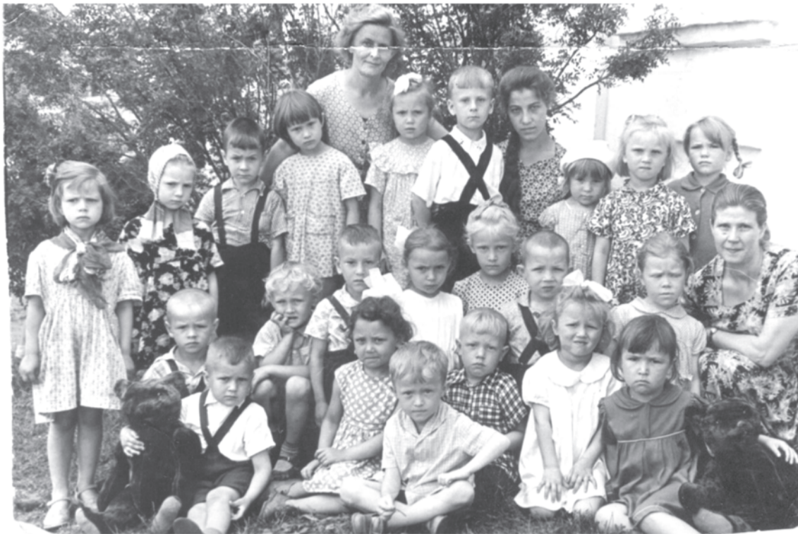
Детский сад, с. Бутка. 1963 год.