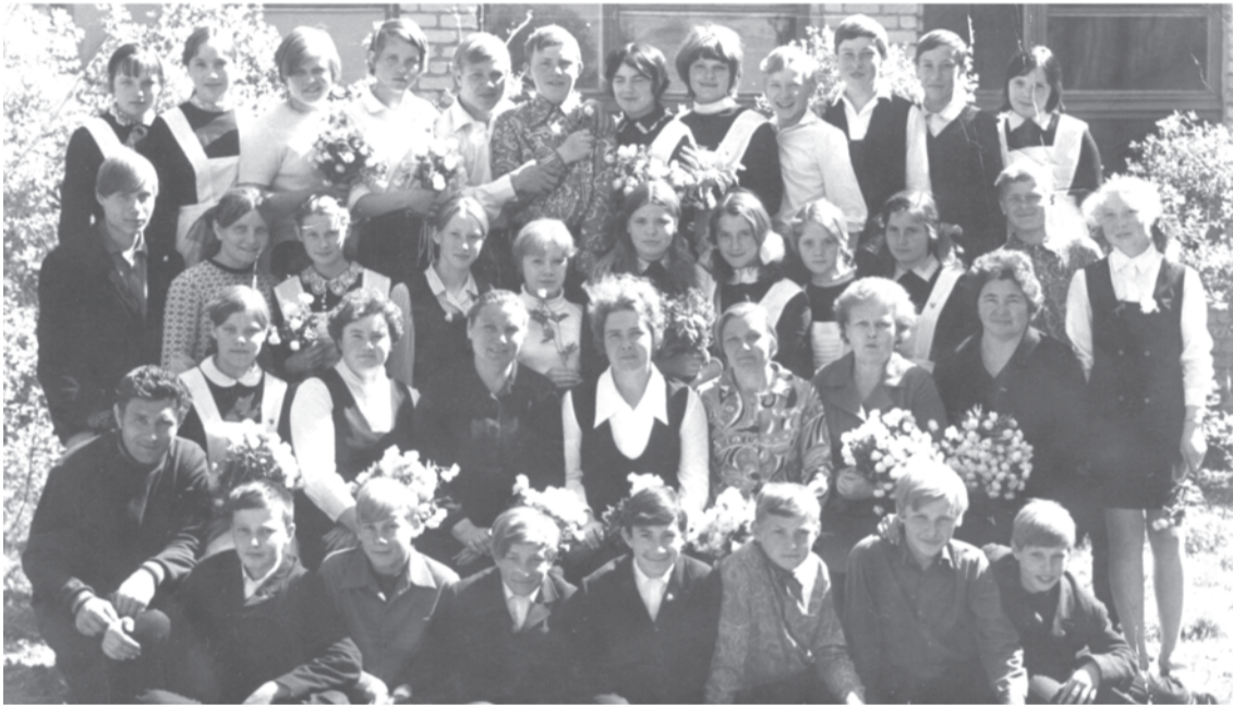
Буткинская 8-летняя школа, 8 «б» класс. 1973 г.