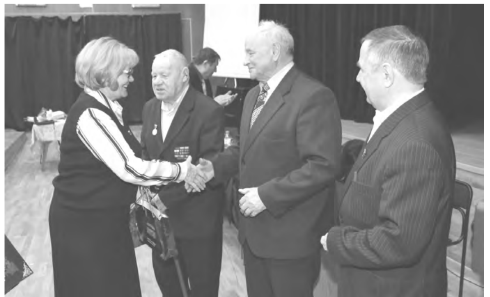
Подарки - мужчинам