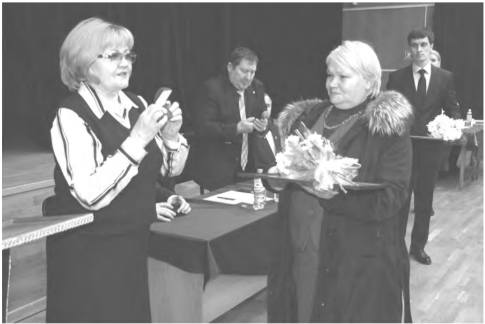
Вручение почётных грамот Законодательного Собрания Свердловской области

После утверждения повестки дня и других организационных моментов участники пленума приступили к рассмотрению вопросов. Но прежде вручи-