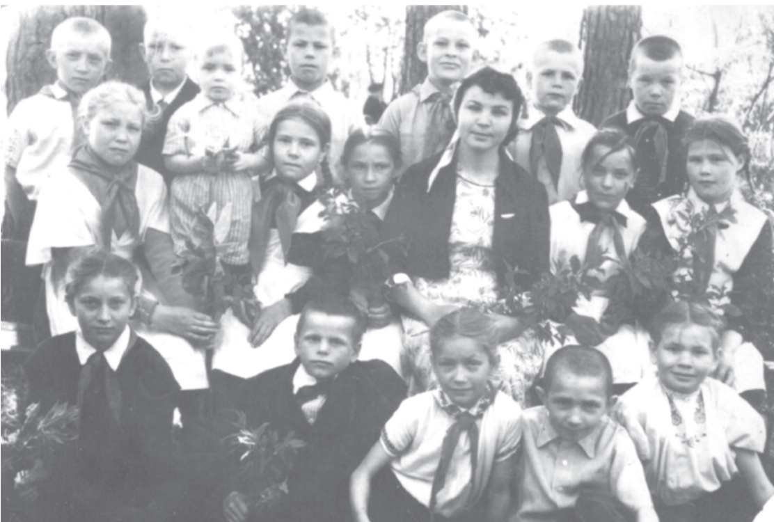
19 мая 1961 г. 3 «б» класс В-Юрмытской школы. Классный руководитель Клара Николаевна.