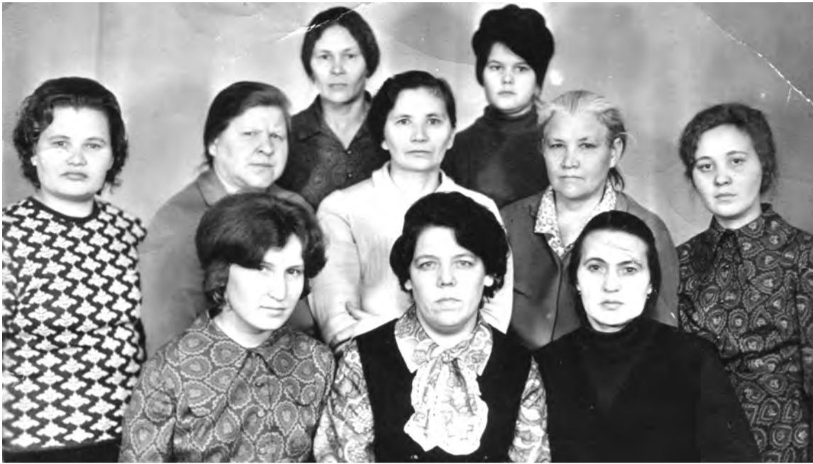
Январь 1972 г. Талицкий быткомбинат. Бригада № 1 швейного цеха.