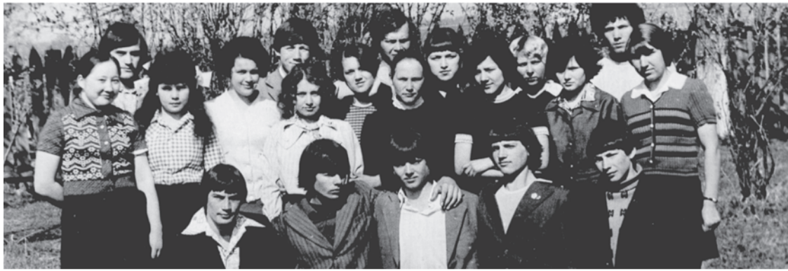
Смолинская средняя школа, 10 «А» класс, выпуск 1978 года