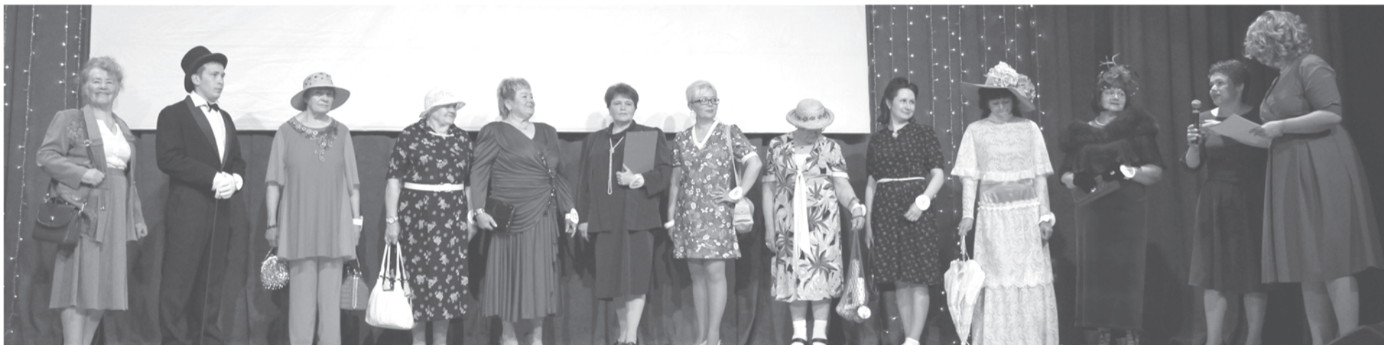
Участники конкурса «Мода из комода»