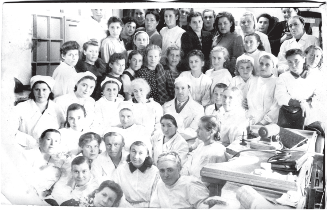
50-е годы. Мед.персонал Талицкой больницы.