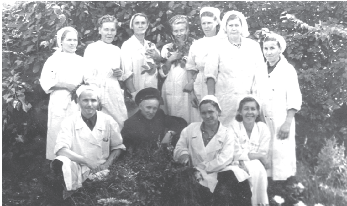
50-е годы. Мед.персонал Талицкой больницы.