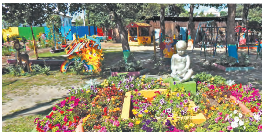
Детский сад «Ромашка»