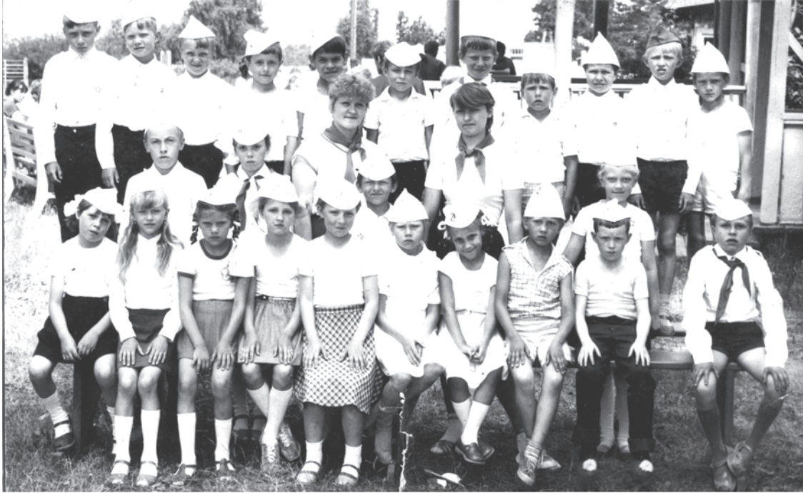
80-е годы. д. Луговая, пионерский лагерь «Дружба».