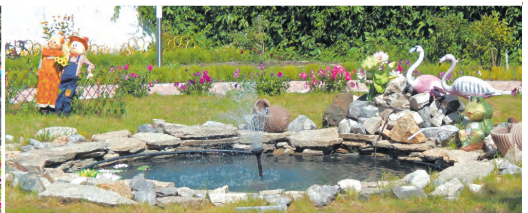
На территории пансионата