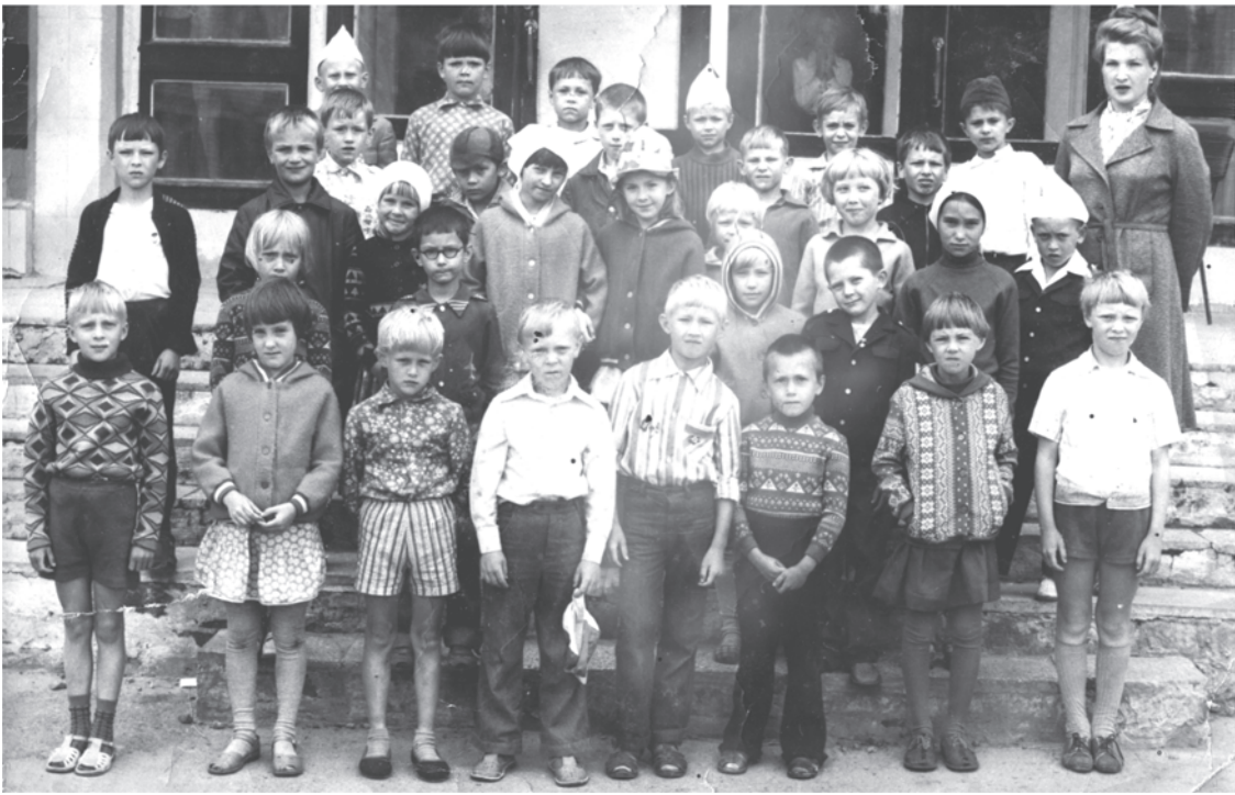
80-е годы. Санаторий «Сосновый бор».