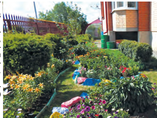
Ул. Кузнецова, 33