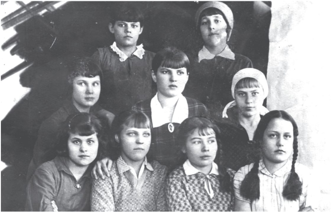
1934 г. VI учебная группа «В» школы ФЗД.