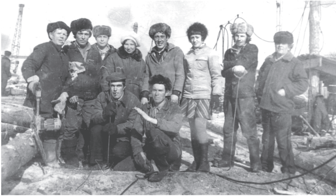
1975 г. Бригада «Мехлеса» (Урга, 19).