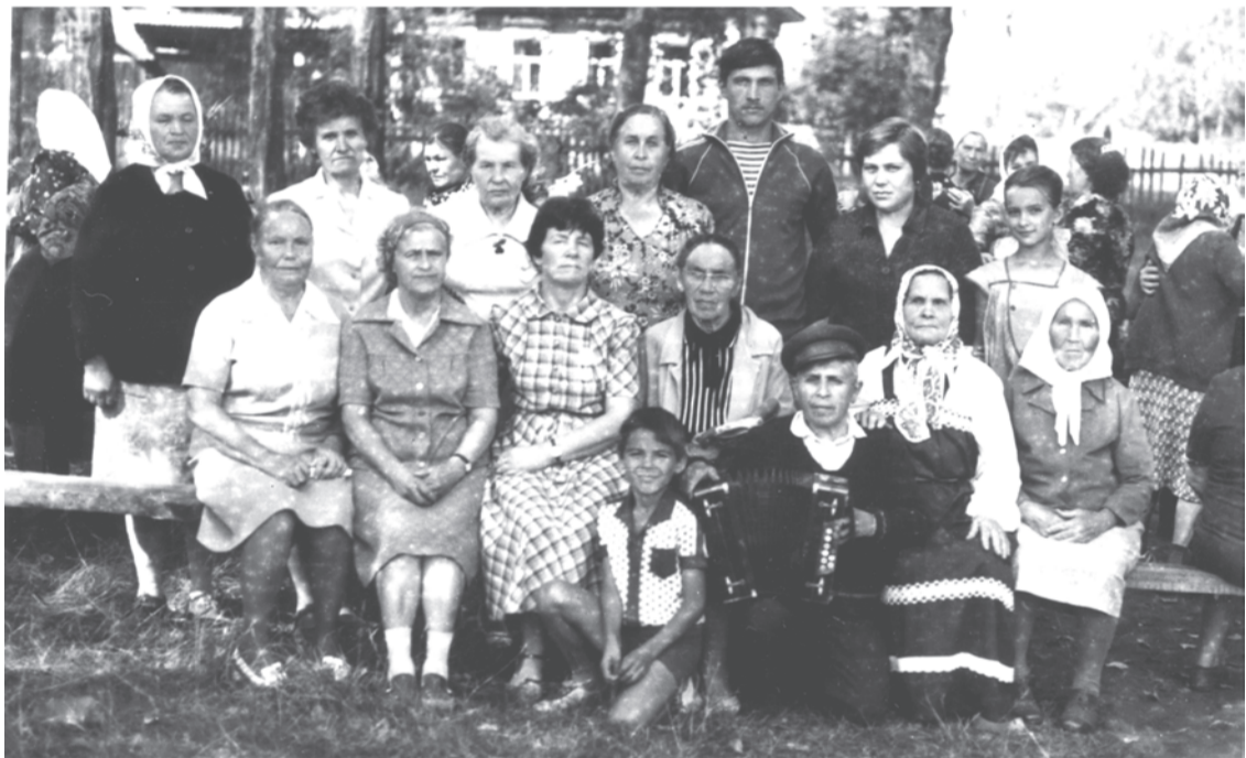
1988 г. Праздник улицы Вакурова. пос. Троицкий.