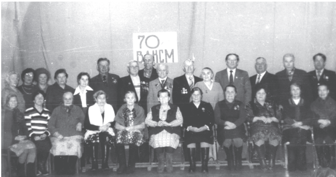
1988 г. Торжество в клубе ДОКа. Пос. Троицкий.