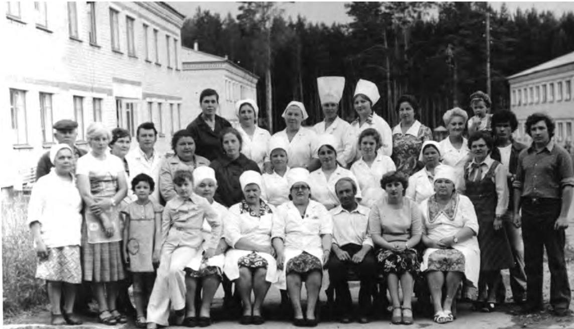
1981 год. Дружный коллектив знаменитого санатория-профилактория «Сосновый бор». г. Талица.

Каждая фотография должна сопровождаться информацией о том, когда и где она сделана, что на ней изображено (или кто изображен), от кого получена.