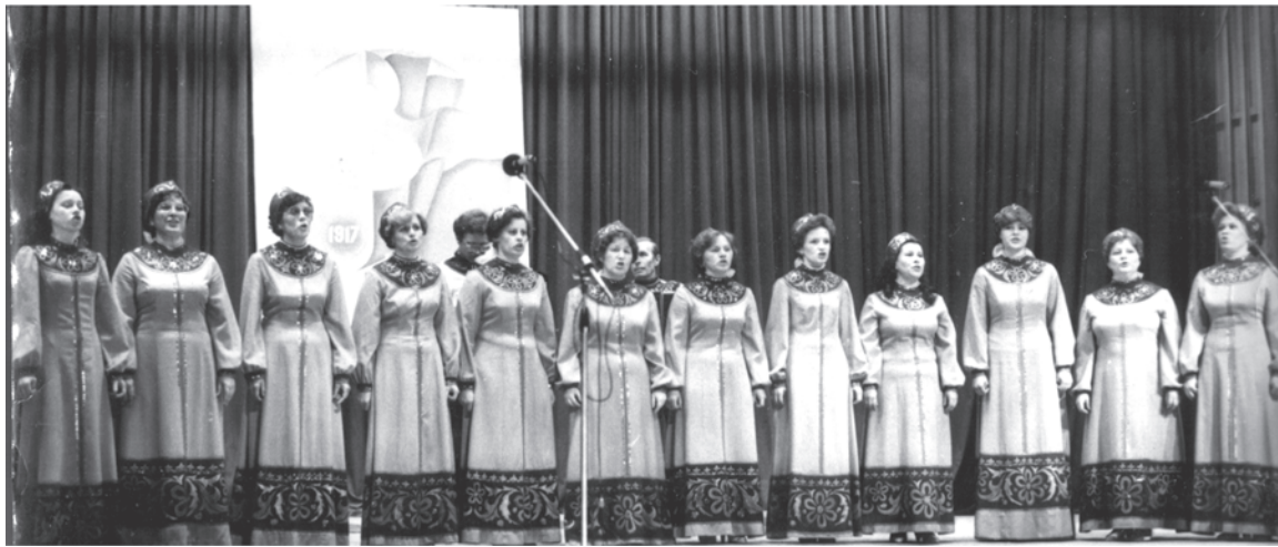
1986 г. Талицкий дом культуры. Народный хор под руководством М. П. Панкратова.