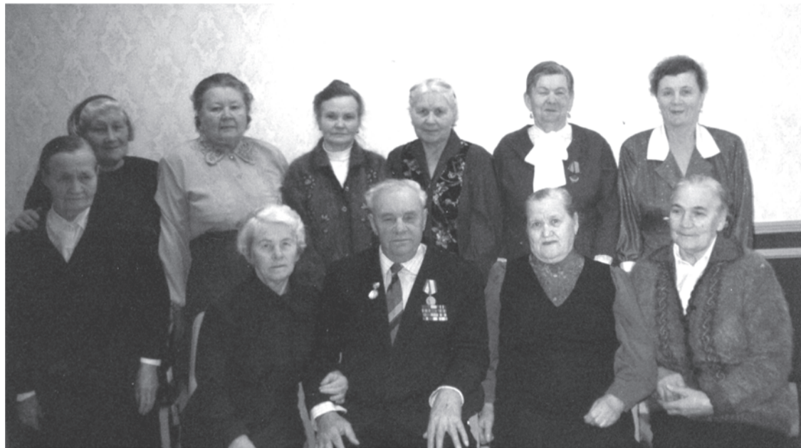
Ноябрь 1998 г. Группа пенсионеров Талицкогo молзавода в год 70-летия завода.