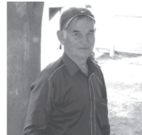
СПК 8-е Марта и Совет ветеранов

У тебя сегодня юбилей, Улыбнись и не грусти. Позабудь хотя бы на мгновение Все бывшие горести свои. Желаем радости и счастья, Здоровья крепкого вдвойне, Желаем самого простого – Пожить подольше на земле.