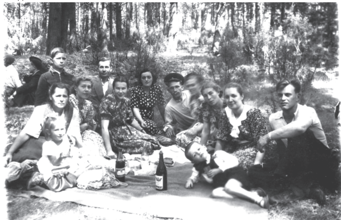
1950 год. Празднование Дня медика на Ургинском пруду.