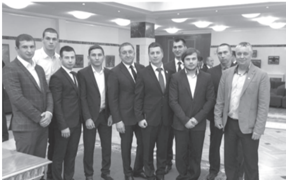
Делегация Талицкого ГО на церемонии подписания соглашения