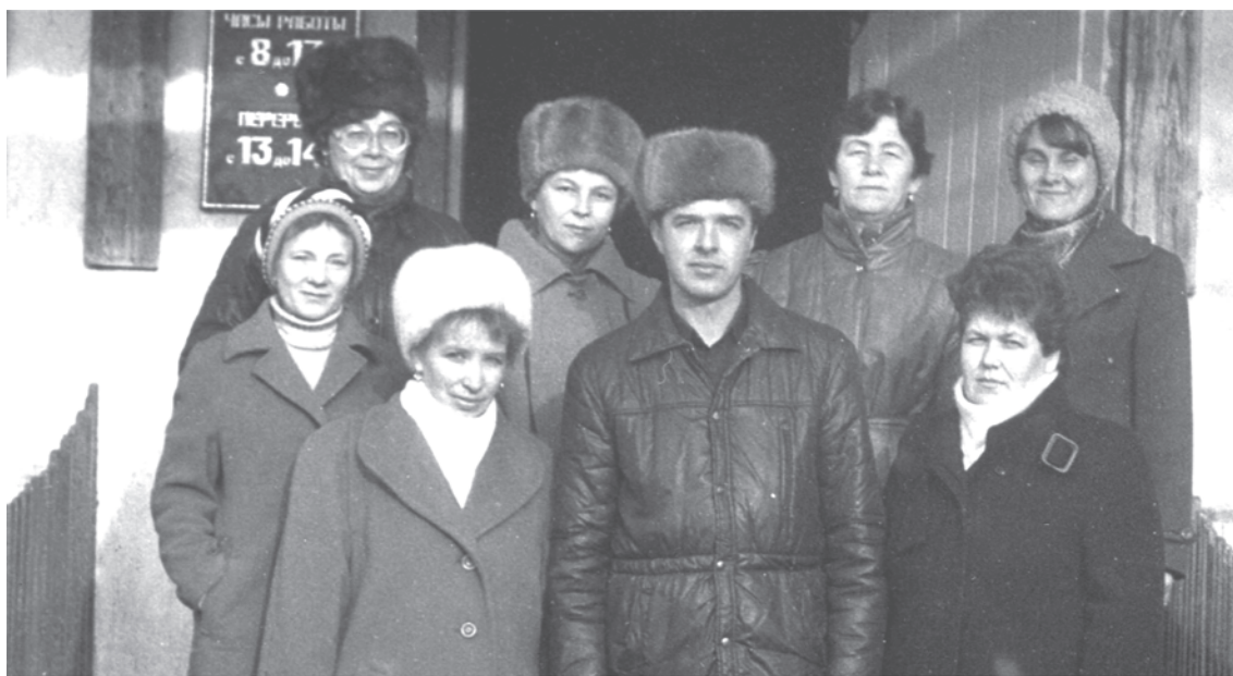
25.10.88 г. Коллектив конторы молзавода.