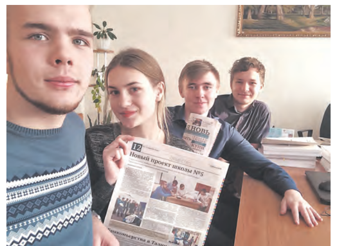
Фото учащихся 10 «А» класса Троицкой школы №5.

✂ КОНКУРС Селфи с «районкой» Я ГОЛОСУЮ ЗА