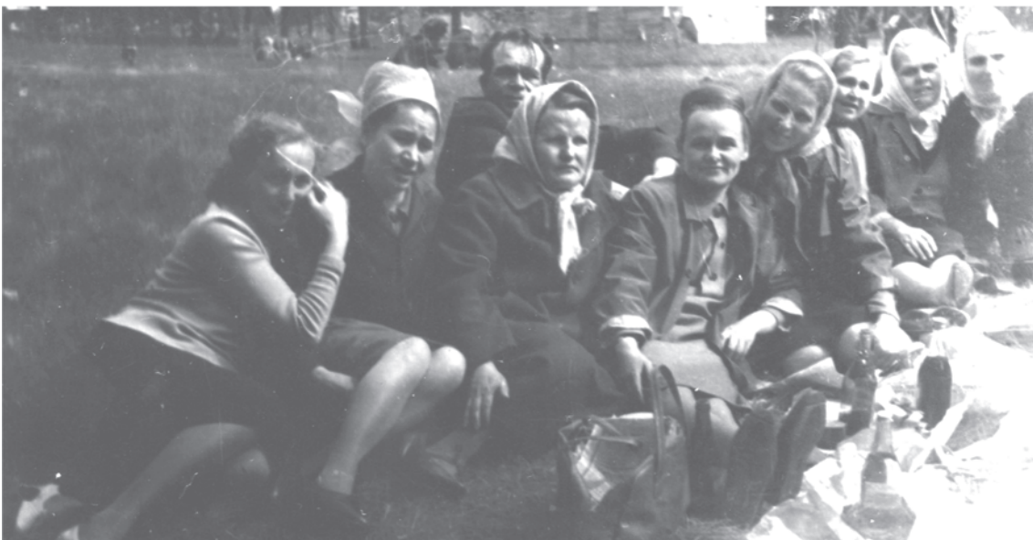
1965 г. Работники фабрики валяной обуви.