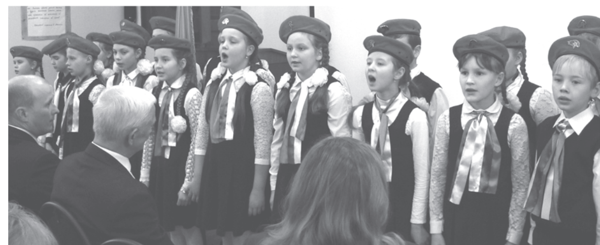
«Эти тоже будут знать, как с Россией воевать», - поют члены клуба «Разведчик» из школы №1 г. Талицы.