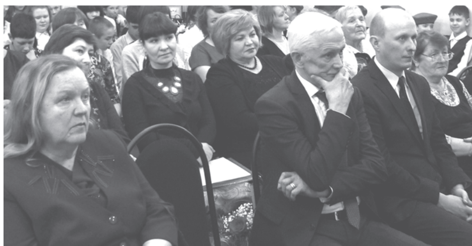
В зале - официальные представители, коллеги по музейной работе

гордостью пели «...Эти тоже будут знать, как с Россией воевать!».