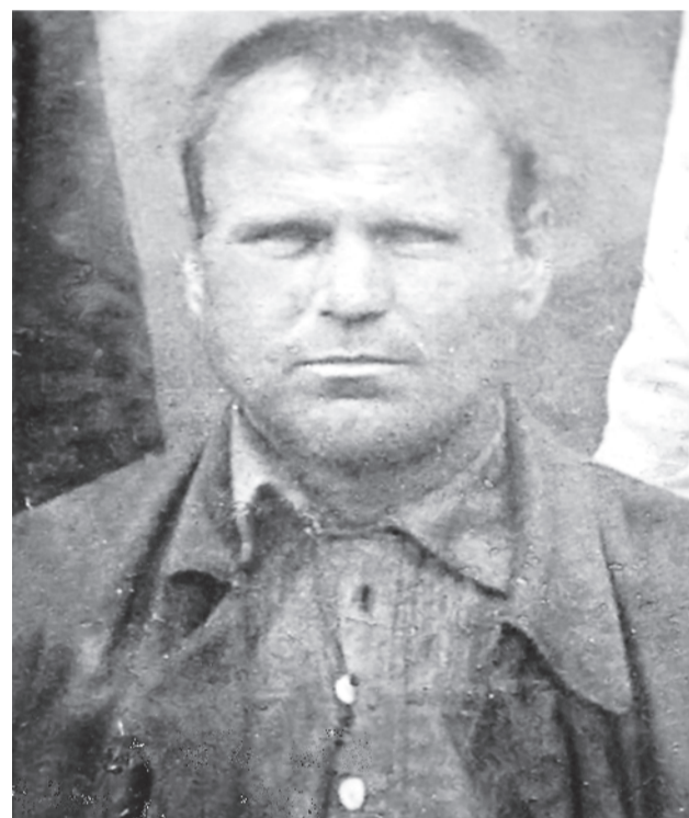
Восстановленный снимок С.Т. Чернова