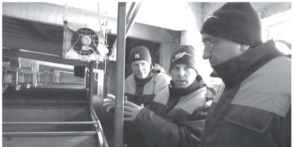
На площадке ЗАО «Талицкое»

Мы не можем привезти в торговые сети самосвал картошки, вывалить во дворе и сказать: «Продавайте!», - говорит