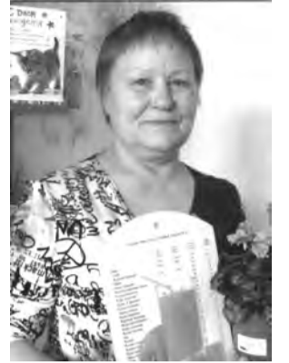
СПК 8-е Марта и Совет ветеранов.

Желаем отличного здоровья и долгих-долгих лет жизни. Пусть будет в доме мир, а в сердце счастье. Пусть сбудутся заветные мечты. Пусть будет твоя жизнь всегда прекрасна. Полна любви, добра и красоты! А также желаем здоровья на долгие годы. Чтоб вас стороной обходили невзгоды, Чтоб счастье и радость не знали разлуки, Чтоб душу согревали вам дети и внуки.