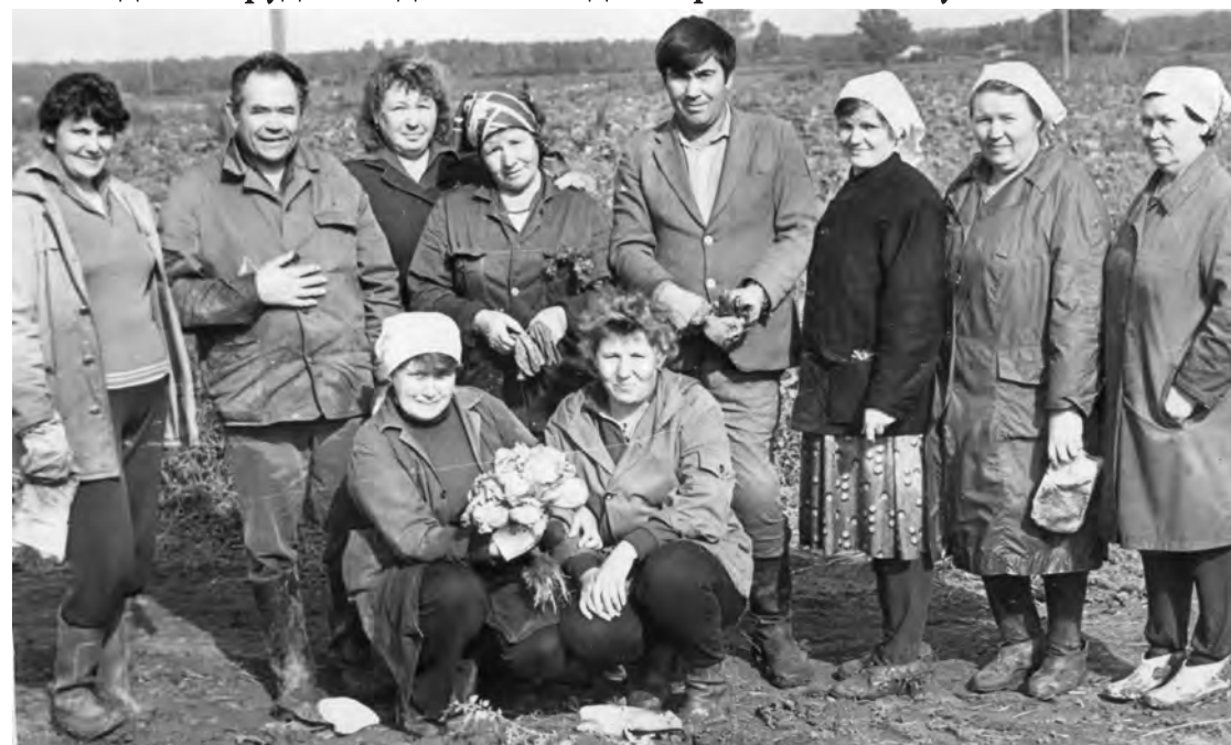
80-е годы. Сотрудники детского сада им. 1 Мая и фабричные работники в колхозе на уборке (с. Яр).