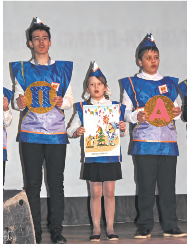
Участники на презентации команды

Из года в год перед жюри стоит нелегкий выбор, ведь мастерство и знания ребят только повышаются. Выбрать одну команду, которая сможет представить себя на окружном слете дружин юных пожарных среди сильнейших конкурентов области, не просто. Здесь необходимо учесть всё!