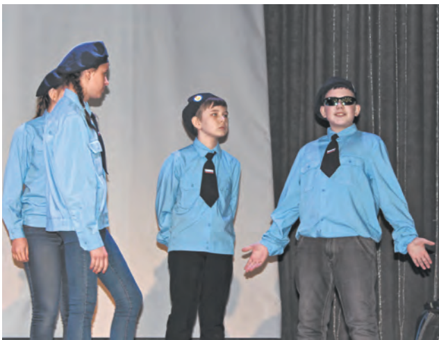
Форма ребятам - к лицу

Кроме этого, баллы команды зарабатывали за презентацию видеороликов – отчетов о проделанной работе, а также творческий конкурс на тему предупреждения чрезвычайных ситуаций.