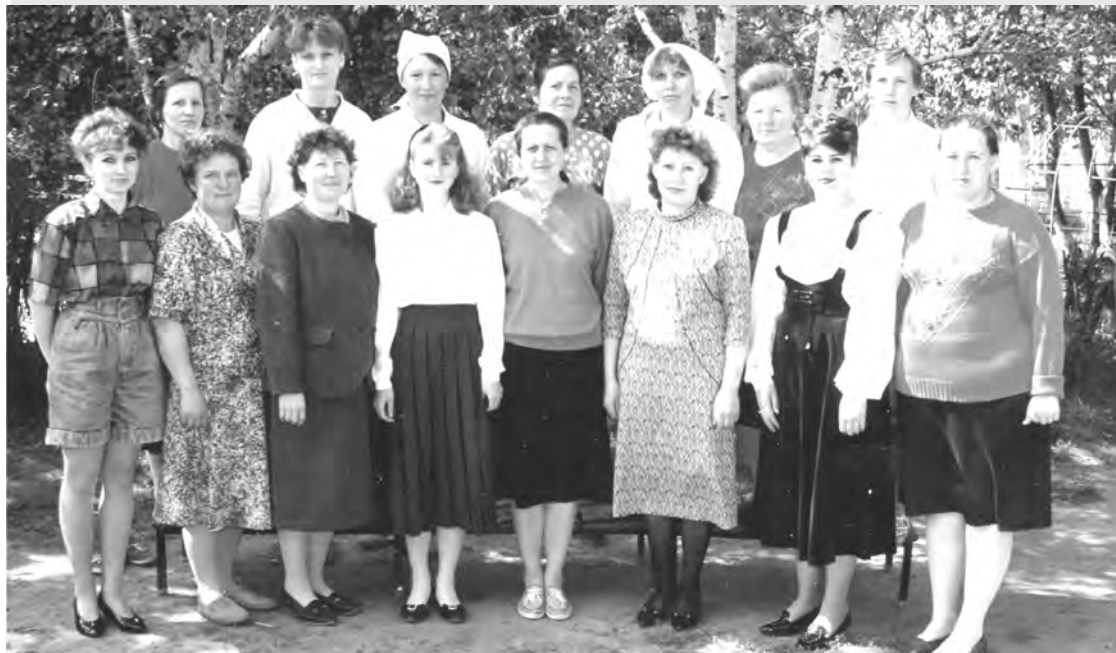
90-е годы. Сотрудники детского сада «Березка». Фото Бучельниковой Г.Н.

Каждая фотография должна сопровождаться информацией о том, когда и где она сделана, что на ней изображено (или кто изображен), от кого получена.