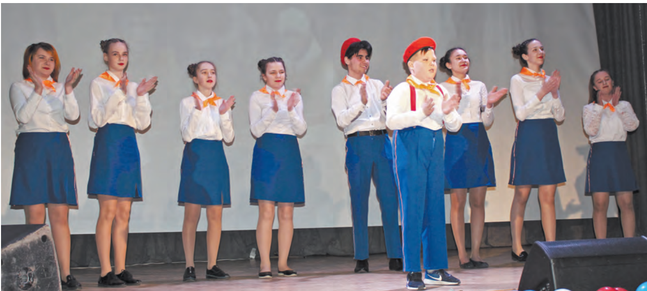
Команда Талицкой школы №1