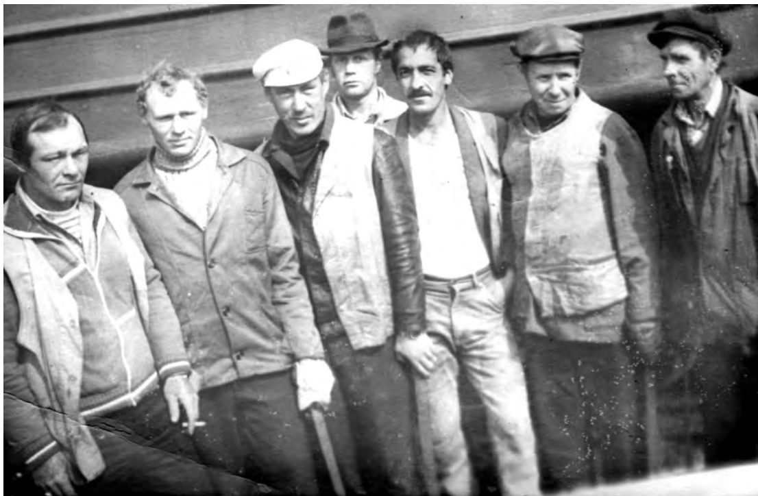
1980-е годы. Работники путевой машинной станции.

Каждая фотография должна сопровождаться информацией о том, когда и где она сделана, что на ней изображено (или кто изображен), от кого получена.