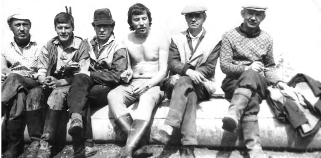
1980-годы. Бригада ремонтников путевой машинной станции.