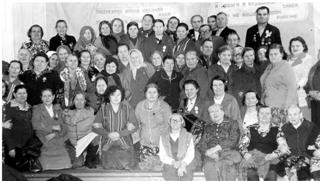
1982 г. Ветераны войны, труженики тыла колхоза им. 8 марта.

Каждая фотография должна сопровождаться информацией о том, когда и где она сделана, что на ней изображено (или кто изображен), от кого получена.