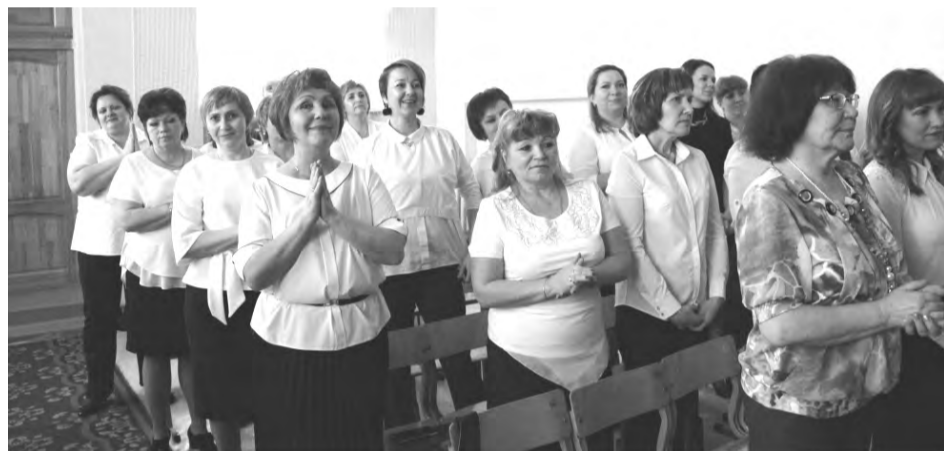
Педагоги школы № 62