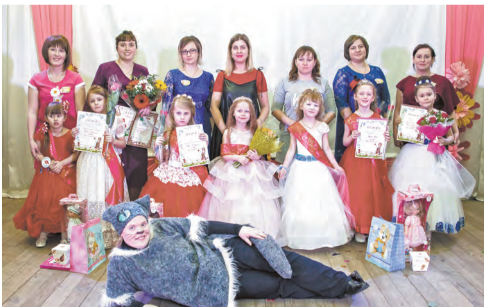
Участницы конкурса со своими мамами