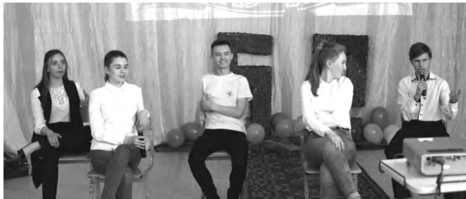
Сценка про школьную жизнь

Учащиеся школы инсценировали каждое десятилетие, которое прошла школа на пути к своему юбилею.