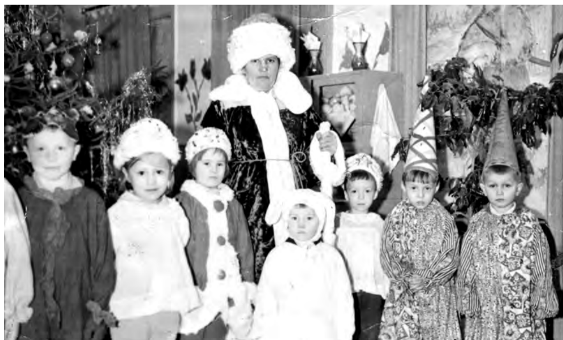
1970-80-е годы. Детский сад «Заготзерно».