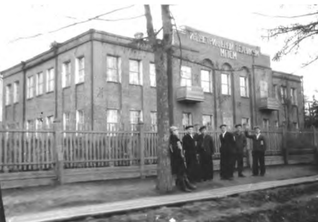
В военные годы техникум стал называться индустриальным.