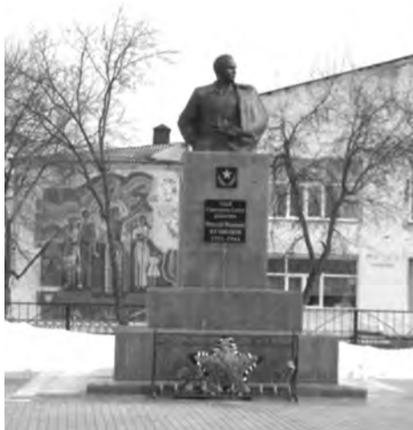
Памятник в пос. Кузнецовском

К примеру, в г.Талице к уборке уже приступили – в сквере ветеранов ВОВ, сквере Н.И. Кузнецова проведены