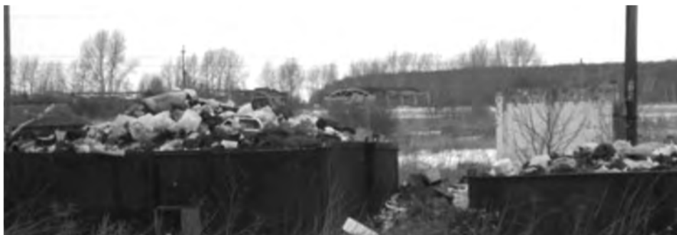
Переполненные контейнеры в д. Пановой

субботники, собран мусор. Планируется завершить работу по сносу и вывозу строительного мусора ветхих аварийных домов. Региональным оператором ЕМУП «Спецавтобаза» организована работа по вывозу отходов с существующих контейнерных площадок, там, где контейнеры не установлены, курсирует машина по графику.