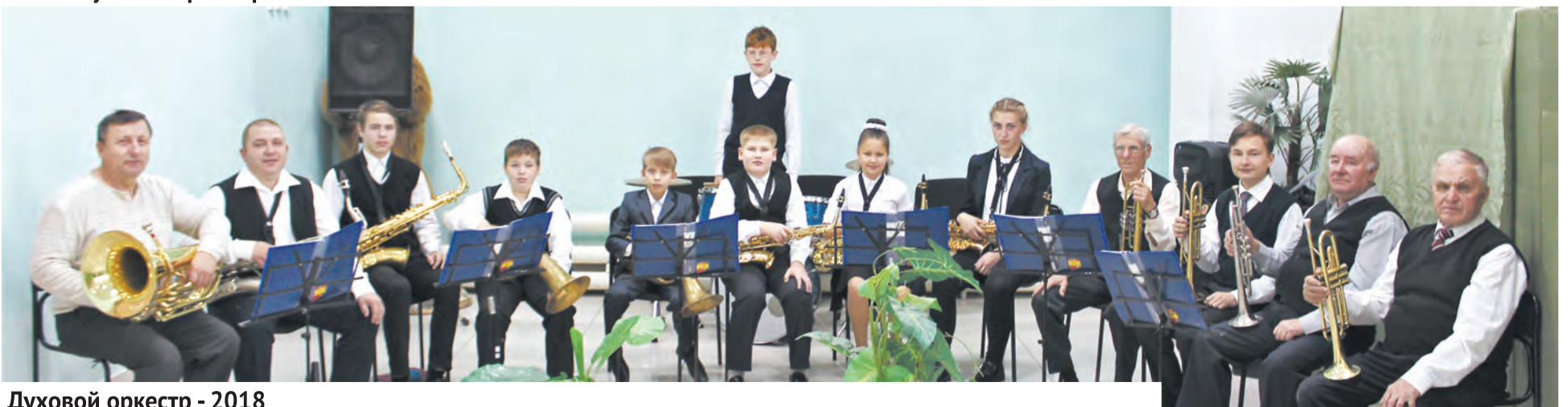
Духовой оркестр - 2018