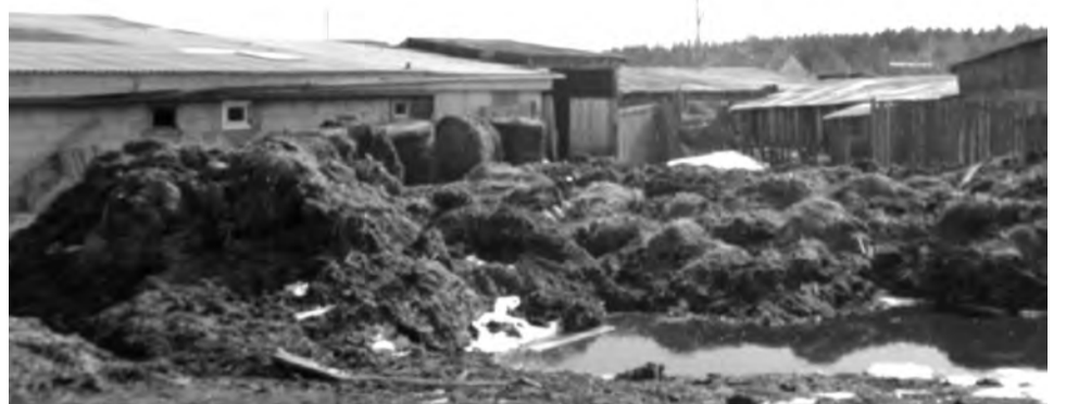
Навозные реки в пос. Троицком