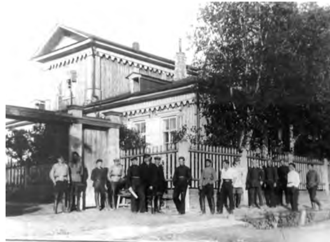
Лесная школа. 1927 г.