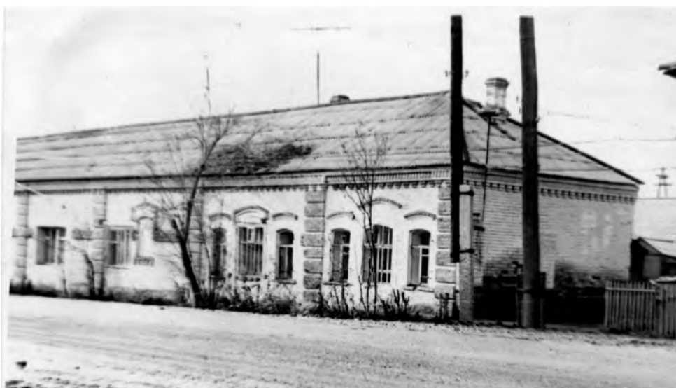
Склады готовой продукции пимокатного производства Угрюмова