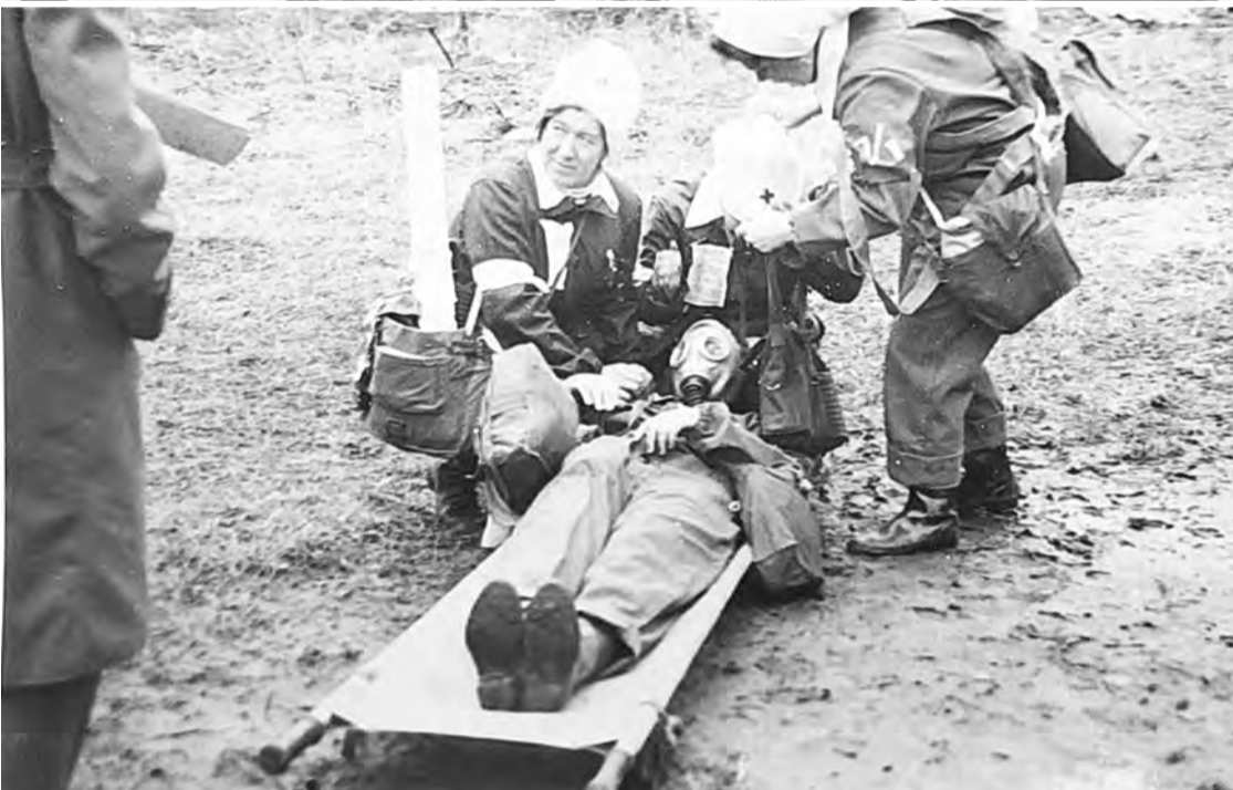
Сандружина от БХЗ, соревнования, 70-е годы