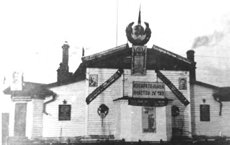
Клуб спиртового завода. 12.12.1931 г.