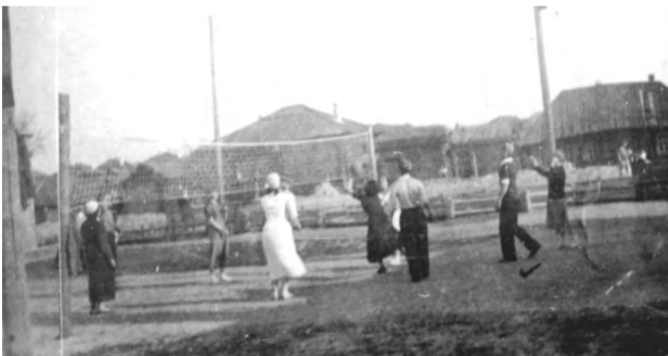
У рабочего клуба. 1936 г.