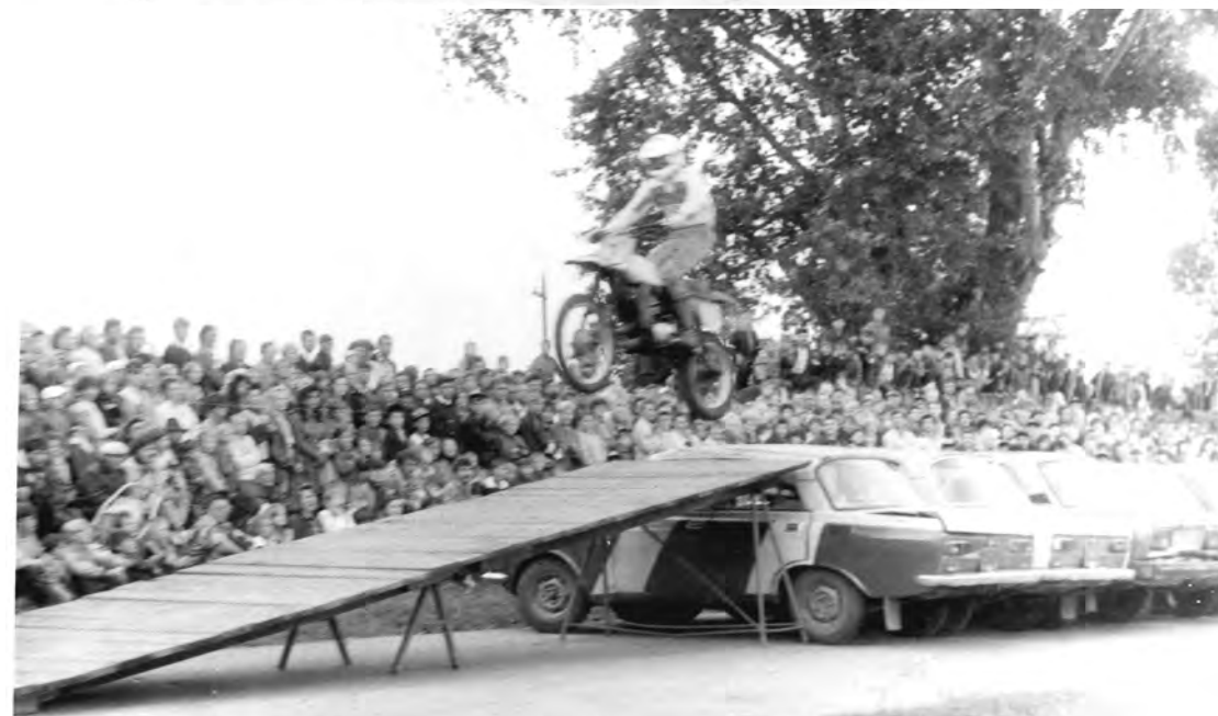
19 августа 1982 г. День города. Московская группа «Автородео» на стадионе БХЗ.