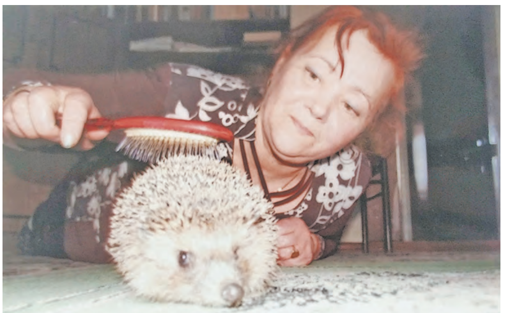
«Мой питомец самый лучший. Не беда, что он колючий. Я колючки причешу. Это нравится ему!».