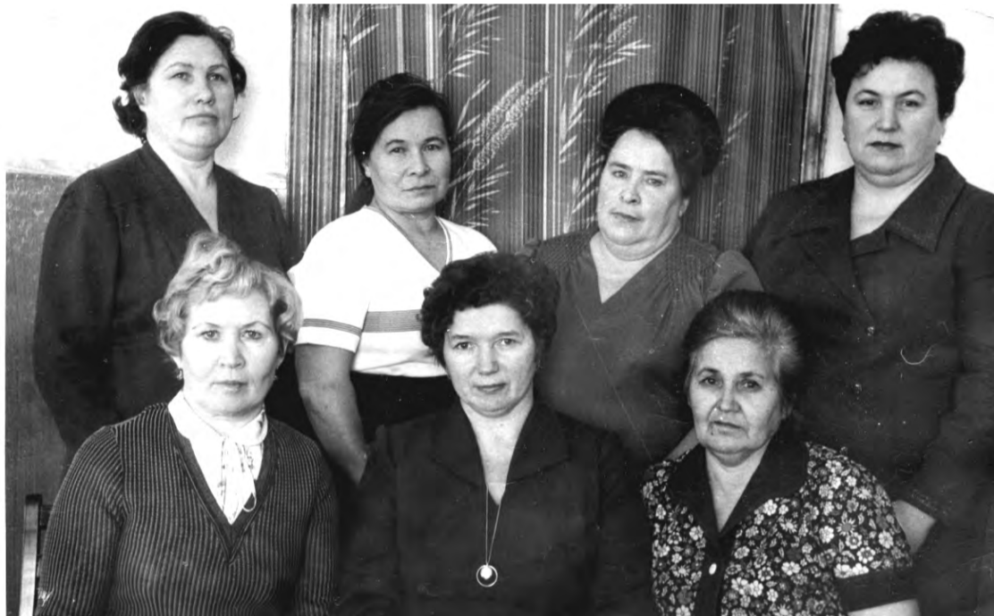
1986 г. 80 лет Талицкому хлебокомбинату. Ветераны труда.