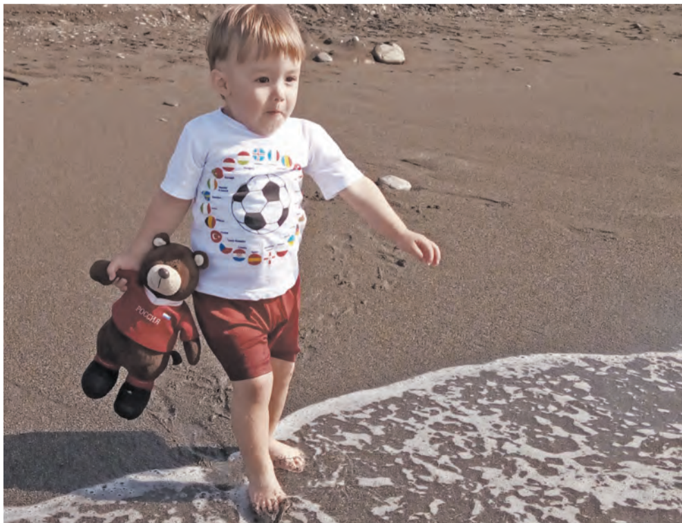
«Дети в кадре», Максим Зятьков, пос.Троицкий.

В каждой номинации будет выбран победитель! А приз зрительских симпатий достанется победителю, который наберет наибольшее количество голосов! На фотоконкурс принимаются качественные, креативные, яркие и эмоциональные фотоснимки.