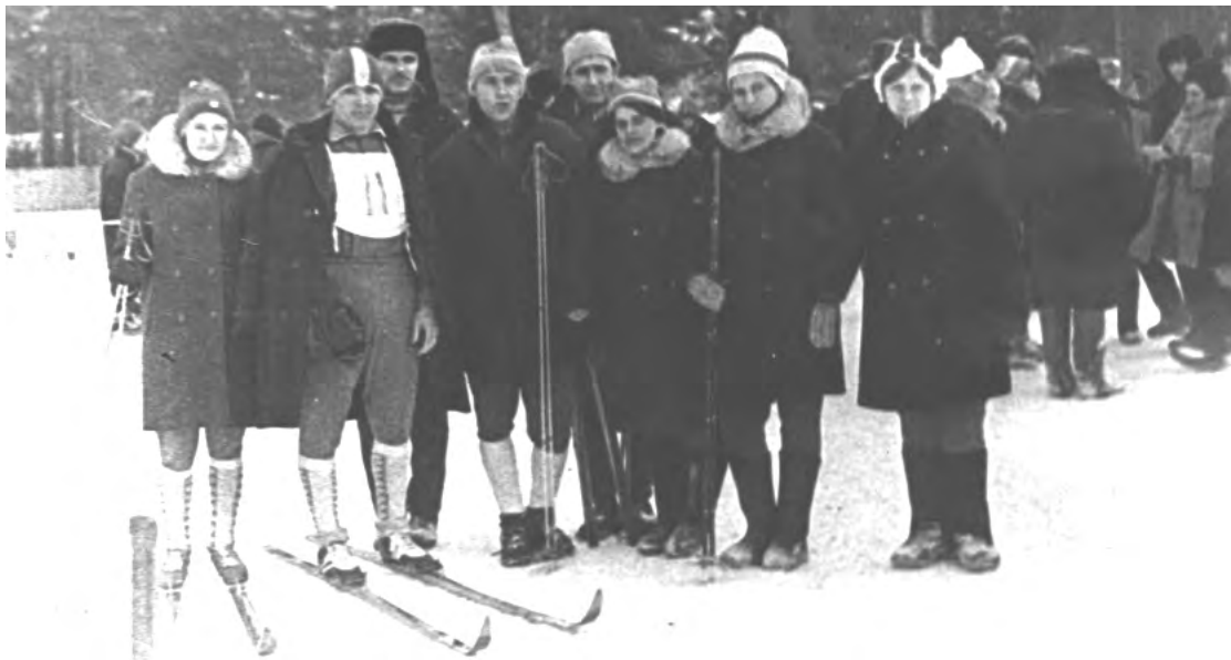
70-е годы. г. Талица. Соревнования по лыжным гонкам у стадиона БХЗ.