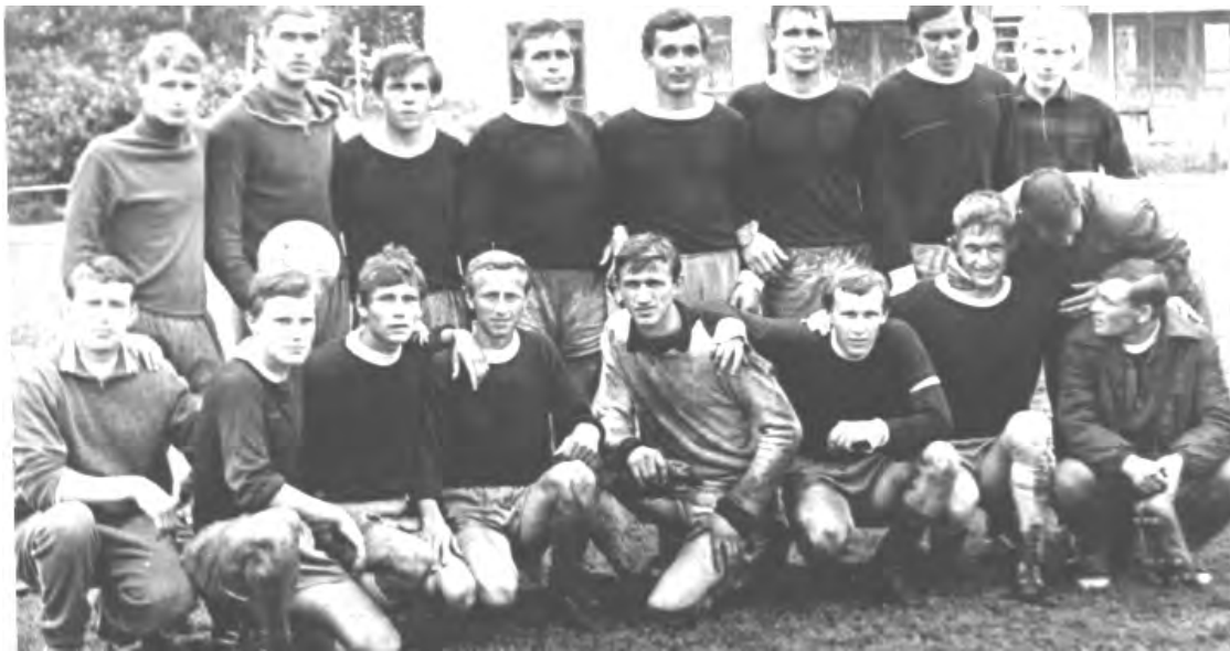
70-е годы. г. Талица. Первая сборная команда по футболу.

Каждая фотография должна сопровождаться информацией о том, когда и где она сделана, что на ней изображено (или кто изображен), от кого получена.