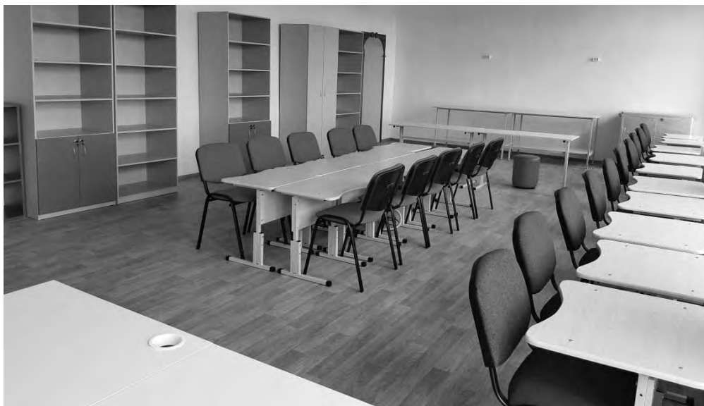
Кабинет во Вновь-Юрмытской школе

На ремонтные работы было израсходовано более 10 млн. 391 тыс. рублей, из них более 7 млн. рублей - средства областного бюджета, более 3 млн. рублей – местного бюджета. На эти средства удалось отремонтировать спортивный зал Вихляевской школы в рамках программы «Развитие системы образования ТГО до 2024 год», эвакуационную лестницу в Троицкой школе №62; в Буткинской школе отремонтировали кабинет химии, провели горячую и холодную воду. На базе трех сельских школ – Вновь-Юрмытской, Кузнецовской и Пионерской - оборудованы кабинеты цифрового и гуманитарного профилей «Точка роста». Данные центры образования позволяют выявлять и развивать способности школьников, а также помогут при работе с одаренными детьми. Инфраструктура кабинетов будет использоваться для развития общекультурных компетенций и цифровой грамотности населения, шахматного образования, проектной