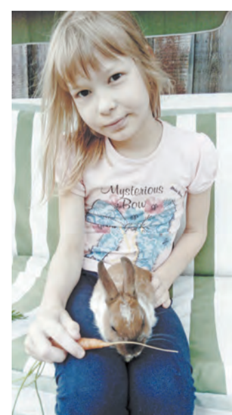
«Я крольчонка обожаю и морковкой угощаю»