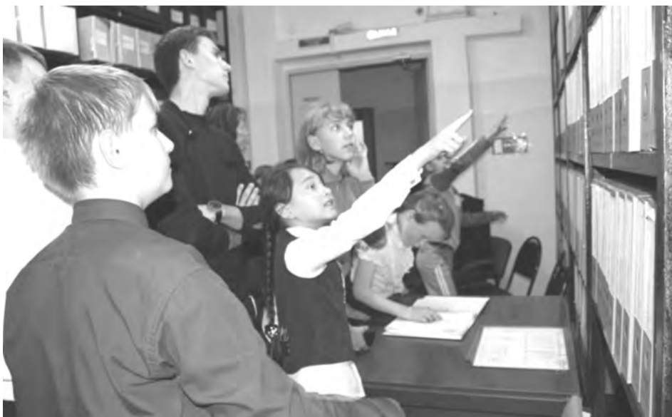
На экскурсии в архиве