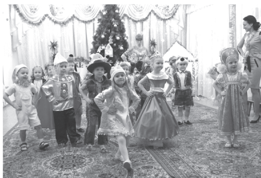
«Веселые садовые будни» Детский сад №2 «Солнышко», г.Талица