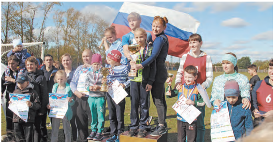
Награждение семей, пос. Троицкий

Закрытием сезона лёгкой атлетики станет «Осенний кросс». 28 сентября школьники смогут показать свои результаты на территории Ургинского пляжа. Приезд участников в 10-00, торжественное открытие в 10-30, старт в 11-00. Параллельно с проведением соревнований будет осуществляться прием норматива Всероссийского физкультурно-спортивного комплекса «Готов к труду и обороне» - «Бег по пересеченной местности».