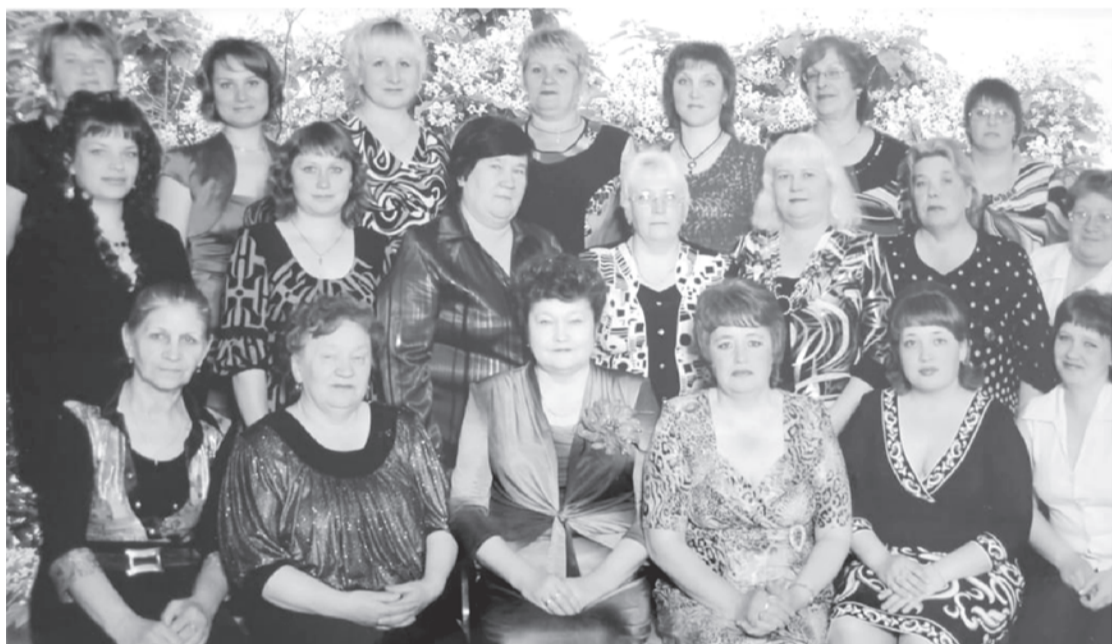
«8 лет назад...». Коллектив детского сада «Тополек».

Для тех, кто хочет вспомнить о своих детсадовских годах и своих вторых мамах, вкус манной каши и молока с пенкой с утра, веселых утренниках, Дедов Морозов в папиных ботинках — фотомарафон от коллективов детских садов и редакции газеты «Сельская новь». Вернемся! Назад, в детский сад!