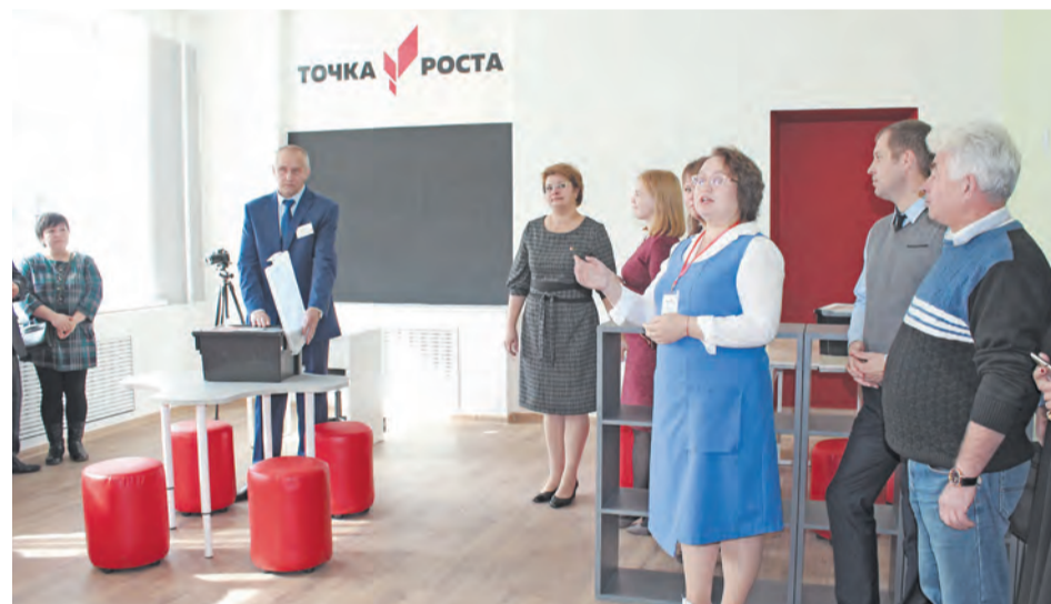
Открытие «Точки роста» в Пионерской школе