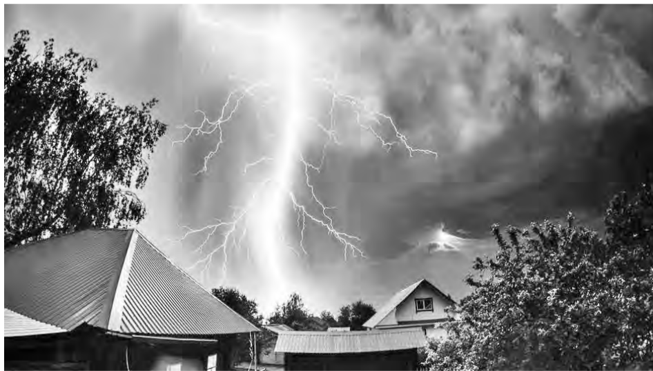
На 25 сентября 2019 года на территории Талицкого ГО произошло 108 пожаров. В огне погибли 5 человек.

Другой случай стал намного печальнее. Сообщение о пожаре в с. Яр на пульт пожарной охраны поступило спустя несколько часов после пожара в пос. Троицком. На его ликвидацию были задействованы сотрудники 86 пожарной части и МПО «Куяровский пост». По прибытию было обнаружено задымление внутри жилого дома. В ходе тушения пожарными был найден труп мужчины, 1938 г.р.