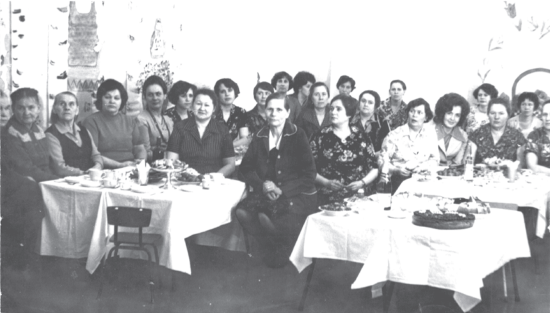
1981 г. Юбилей детского сада им. 1 мая (20 лет).