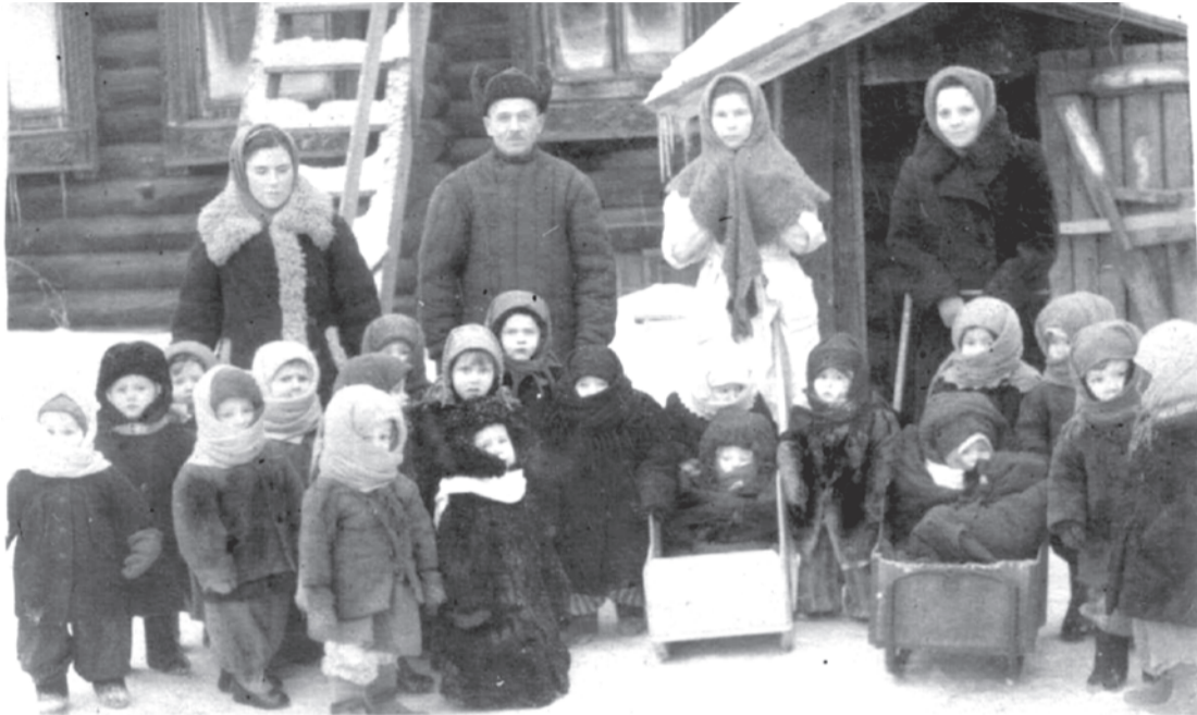
1948-1949 гг. Первые воспитанники детского сада им. 1 мая.

Каждая фотография должна сопровождаться информацией о том, когда и где она сделана, что на ней изображено (или кто изображен), от кого получена.