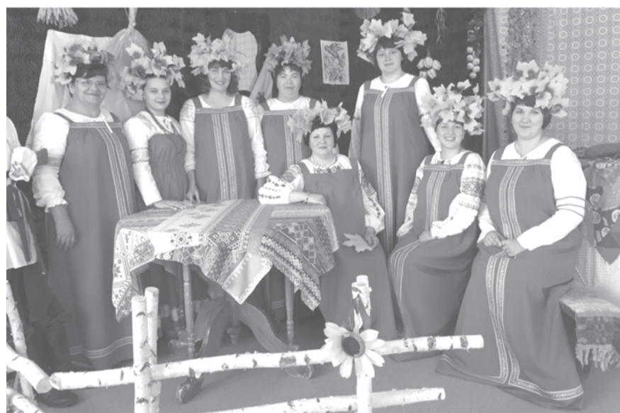
Воспитатели детского сада № 5 «Елочка»