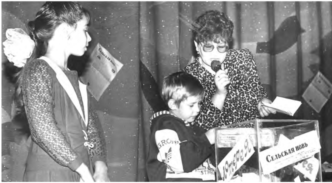
1999 г. Разыгрывается лотерея районной газеты «Сельская новь». г.Талица, Дом культуры.

Каждая фотография должна сопровождаться информацией о том, когда и где она сделана, что на ней изображено (или кто изображен), от кого получена.