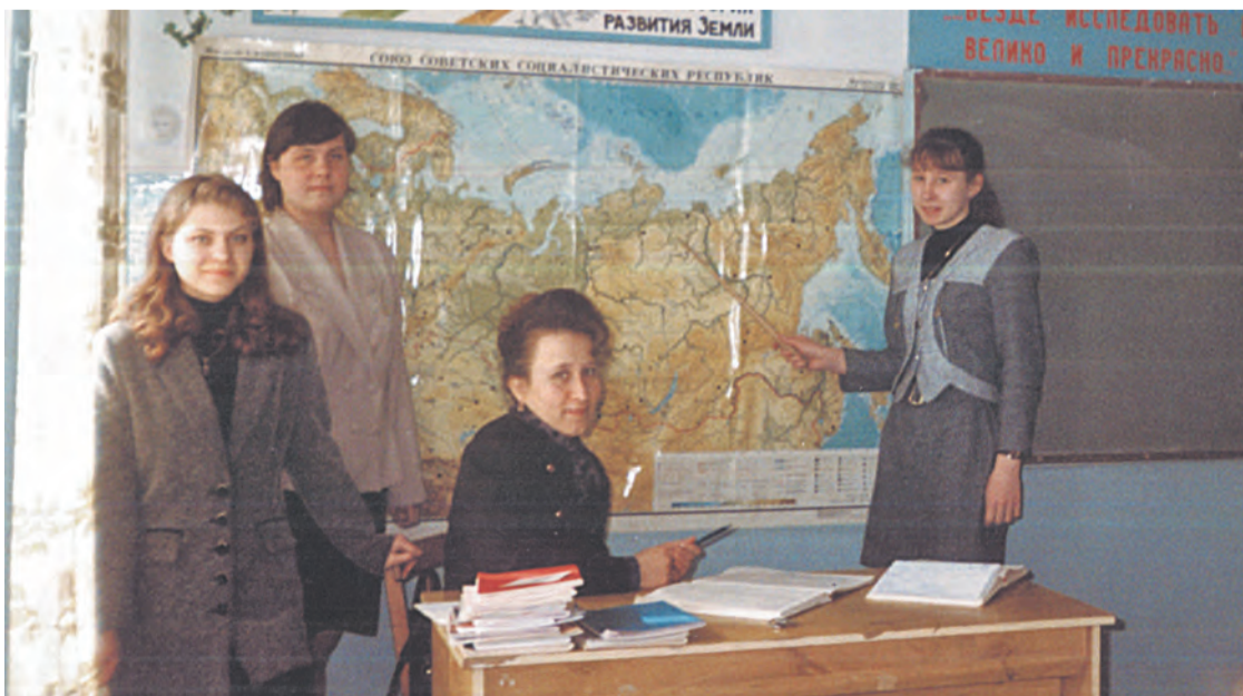
Школа № 1, 11 «А» класс на уроке географии. 20 лет назад...

Даём старт фотоконкурсу «Одноклассники», ждём ваших фотографий!