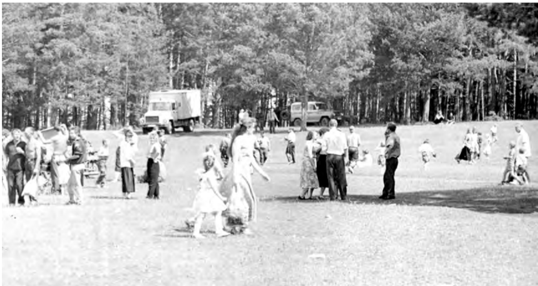
1993 г. Гуляние и отдых на Ургинском пруду. г. Талица.