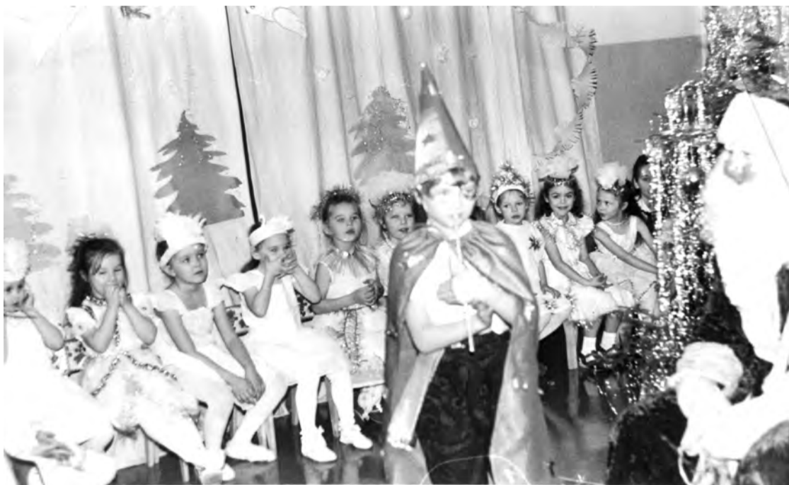
1992 г. Новогодний утренник в детском саду «Елочка». г. Талица. Фото Г.И. Антроповой.

Каждая фотография должна сопровождаться информацией о том, когда и где она сделана, что на ней изображено (или кто изображен), от кого получена.