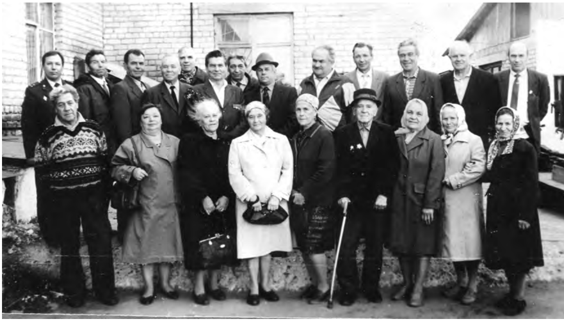
Начало 80-х годов. Ветераны МВД.

Каждая фотография должна сопровождаться информацией о том, когда и где она сделана, что на ней изображено (или кто изображен), от кого получена.