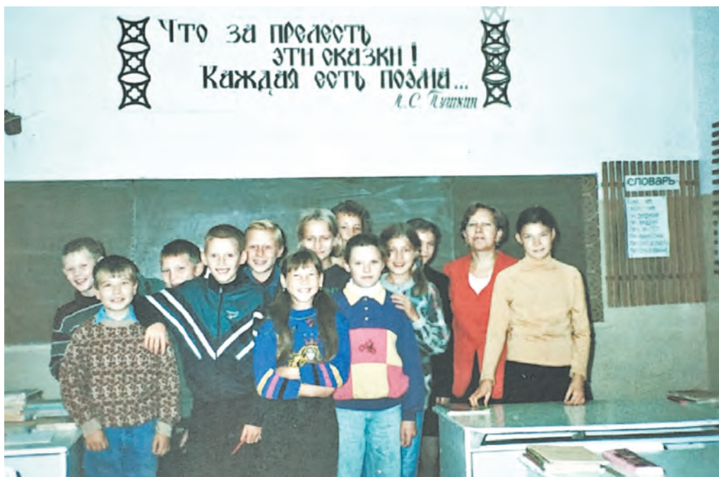
5 класс, 1998-99 гг., школа №8, фото Н.Г. Зуевой.

Свои фотографии присылайте или приносите в редакцию, на нашу электронную почту: gazeta-sn@mail.ru . Не забудьте придумать к фотографии подпись, указать своё имя и фамилию, а также номер телефона для связи. Ваши фотографии будут опубликованы в газете, а победитель определится по традиции с помощью купонов для голосования. Чем больше купонов за фотографию будет отправлено в редакцию, тем больше шансов получить приз. Купон будет публиковаться с каждой конкурсной фотографией.