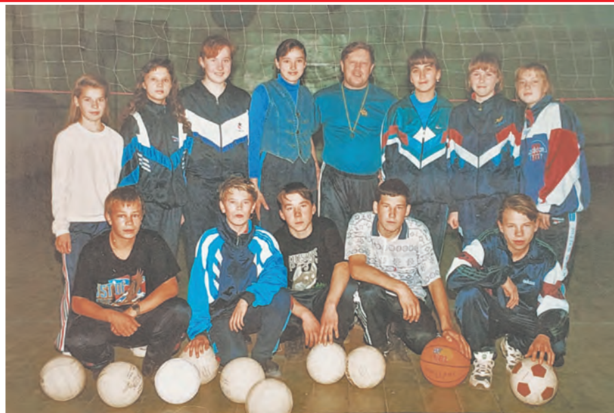
9 класс, 1996-97 гг., школа №8.

Ах, маленькая школа, Что за рекой Пышмою, Как ты мне дорога. Где Родина моя.