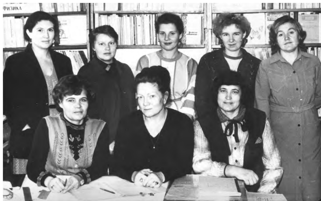
25 сентября 1987 г. Методический кабинет РОНО.