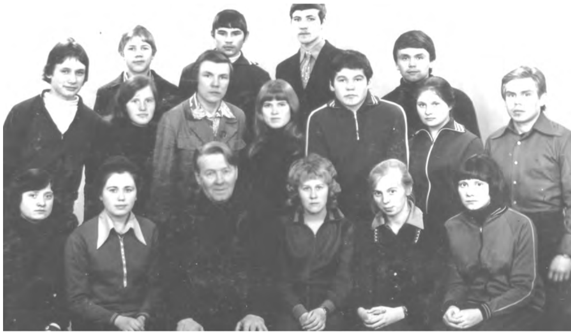
1978-1979 г. Команда ТЛТ по легкой атлетике.

Каждая фотография должна сопровождаться информацией о том, когда и где она сделана, что на ней изображено (или кто изображен), от кого получена.