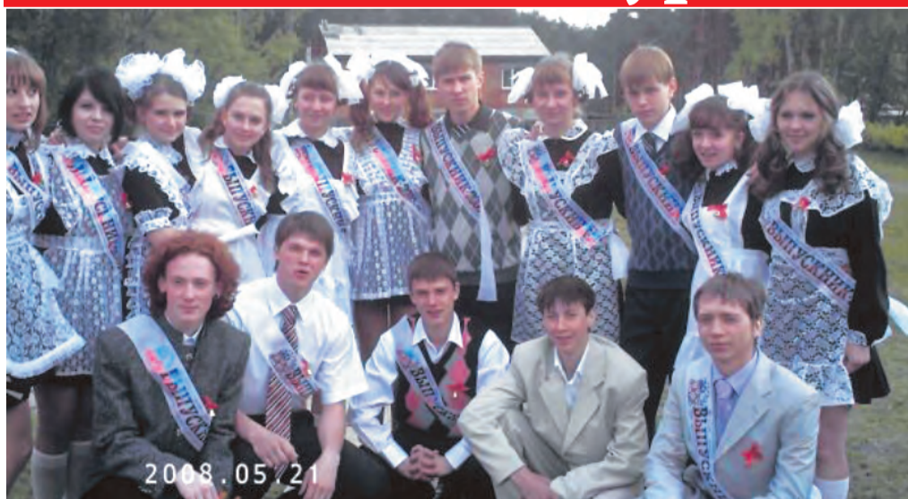
Последний звонок, 11 «Б» класс, 2008 год.