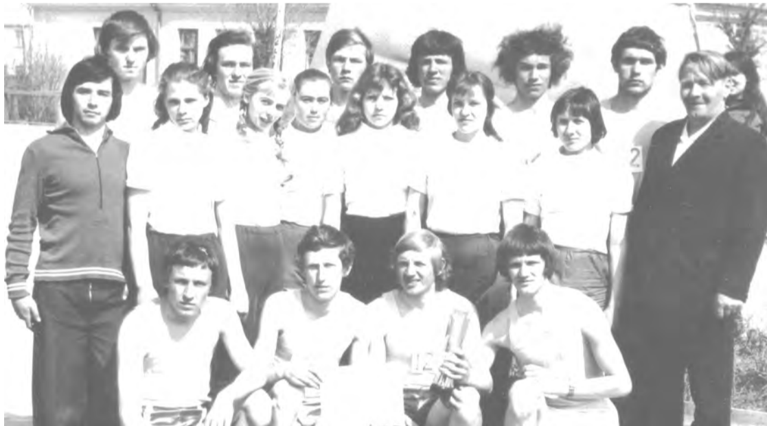
25 апреля 1976 года. Команда ТЛТ, занявшая первое место в городской эстафете на приз Н. И. Кузнецова.