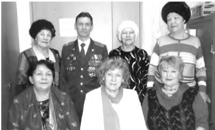
Члены бюро Талицкого городского Совета ветеранов

Председателем городского Совета, членами бюро, председателями первичных ветеранских организаций своевременно проводятся текущие дела и мероприятия по ведению документации, информированию пенсионеров о мероприятиях и освещению в СМИ по всем направлениям деятельности городского Совета ветеранов. Активисты приняли участие в благоустройстве «Сквера ветеранов», сборе макулатуры, в активной работе по вовлечению ветеранов в развитие их индивидуальных способностей по интересам. Это вязание, лепка, плетение и т.д. Многие ветераны прошли через школу пожилого возраста «Творческая прикладная деятельность» и «Компьютерная грамотность» при Комплексном центре Талицкого района; участвовали в работе клубов «Мир женщины», «Золотая осень». Впервые, в 2018 году, Талицкий городской