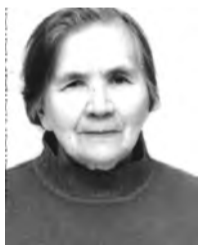
Родные и близкие.