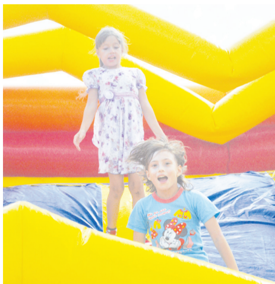
Ничего на свете лучше нету, чем попрыгать вдоволь на батуте!