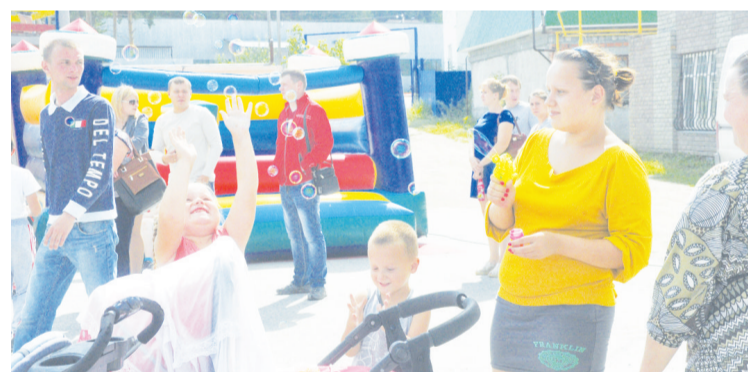
А много ли для счастья надо? Маму, солнышко и банку мыльных пузырей!