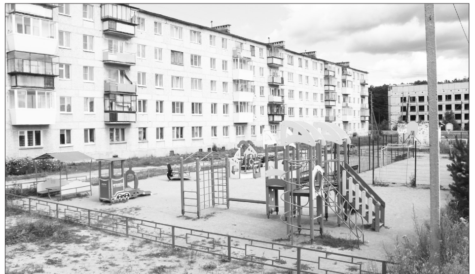
В 2012 году почти 2 миллиона было потрачено на детскую площадку в сысертском микрорайоне «Новый»