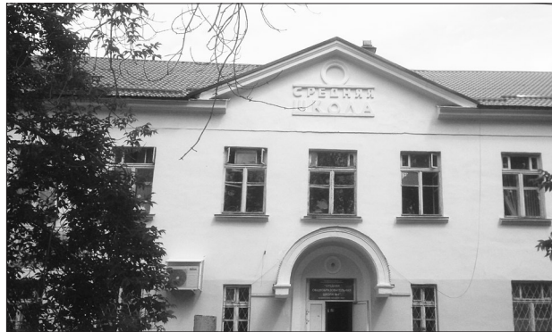
В арамильской детской школе искусств и школе №4 отремонтированы кровли