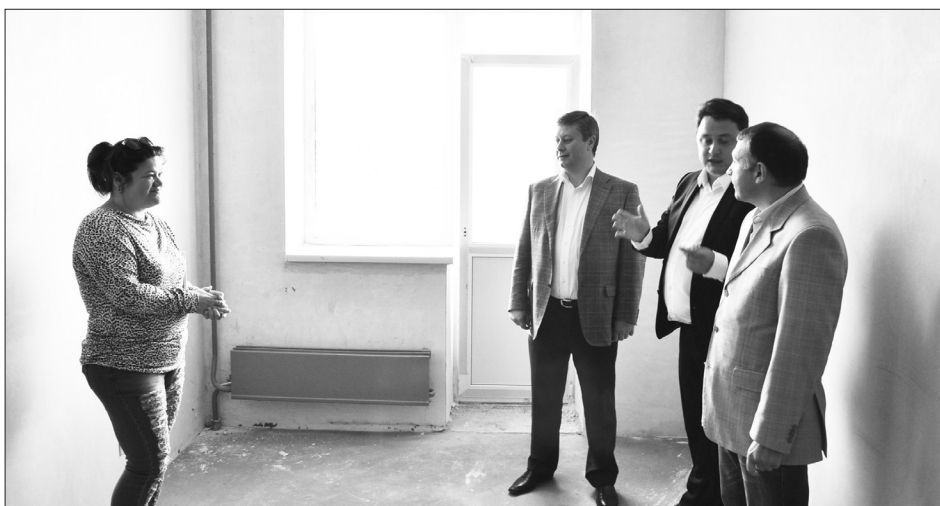
Слева - счастливая обладательница 3-комнатной квартиры в новостройке