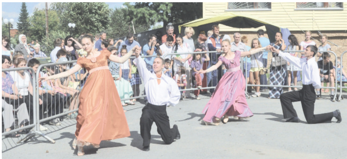
Акцию «Вальс Победы» в миниатюре подарили собравшимся ребята из большеистокской ДШИ – танцевальная студия «Априори»

ный желающий, заглянувший в администрацию Большого Истока, где установят специальный ящик для сбора благотворительных средств. И, если должная сумма соберётся, 333-ий день рождения большеистокцы и гости торжества действительно отметят уже в парке, а не на площади у администрации. А что ещё было в программе Дня посёлка – расскажут фотографии.