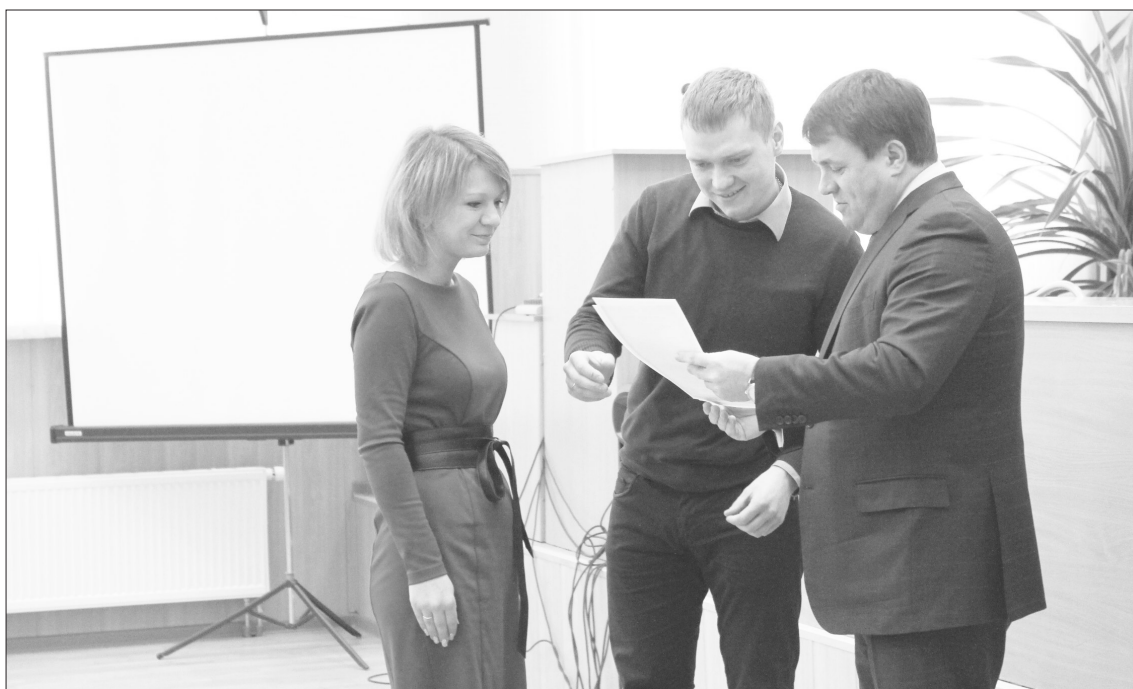
Вручение сертификата на социальную выплату молодой семье в 2013 году