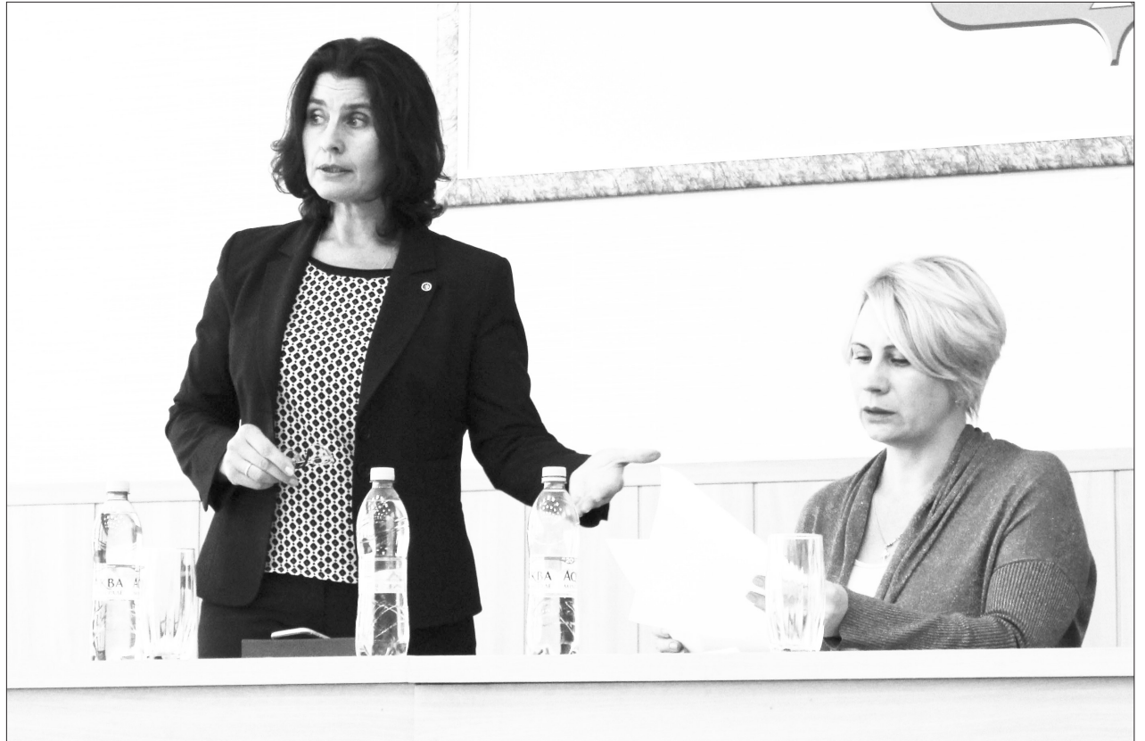
«...Мы, предприниматели, знаем, что кроме тебя самого никто не сделает...»

много вопросов, которые могут быть решены по максимуму «нет» или по максимуму «да». Или максимально запретить или максимально разрешить. И вот внутри этой вилки, на мой взгляд, и лежит понятие предпринимательского климата. Если муниципальные власти настроены на то, чтобы в условиях возможного выбора принять решение «да, разрешить, продлить», то это хороший предпринимательский климат. Тогда люди остаются здесь работать, создают рабочие места, формируют бюджет. Если же муниципалитет стремится в пределах этой вилки в сторону запрета, расторжения и так далее, то здесь, наверное, можно говорить о плохом предпринимательском климате и недостаточном понимании того, как он должен развиваться. Как раз в этом поле и нужно продолжать диалог. Один из инструментов нормального взаимодействия, выстраивания отношений – это встречи. Я полагаю, что они должны происходить чаще. Чтобы какие-