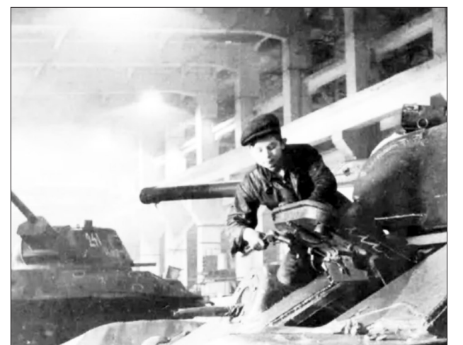
Идет сборка танка Т-34