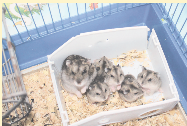
Хомячата с мамой