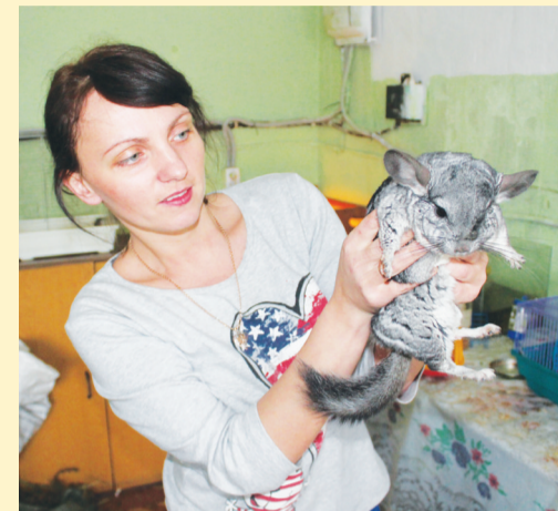
Пушистые шиншиллы очень нежные, их несложно и "залюбить"...

Недороги и не особо прихотливы морские свинки. Кушают овощи и фрукты, геркулесовые хлопья, сухари. Этим животным нужно периодически подстригать ногти, иначе ноготь вырастет, загнет и