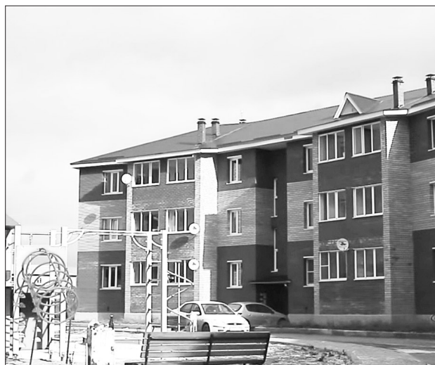
Да, огородиками здесь и не пахнет