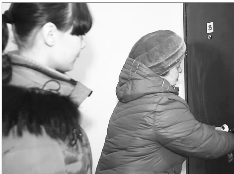
Сколько лет жители барачных домов ждали этого мгновения: открыть дверь в свою новую квартиру!

ждала переселения из хлипкого и холодного деревянного дома, есть красивая, пахнущая свежим ремонтом квартира с индивидуальным санузлом, горячей водой, отоплением, отдельной кухней, стеклопакетами и счётчиками на воду в большинстве микрорайоне