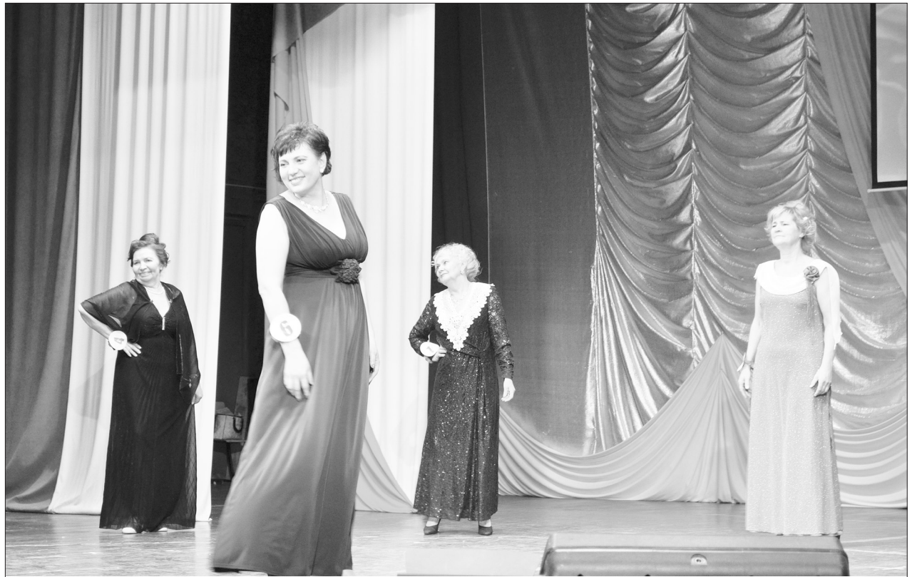
Именно этим очаровательным «героиням дня» 24 октября пел Меладзе: «Ты так красива сегодня!..»