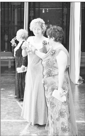
Не обманули ведущие, сказав, что за время репетиций номеров соревнования все участницы стали подружками, а не соперницами!