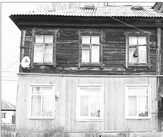
Старые бараки уходят в историю...

Ф.И.О. _____ Тел. _____ Населенный пункт _____