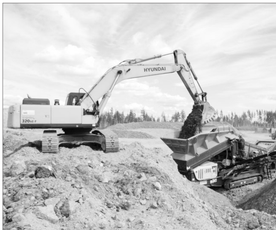
НАША СПРАВКА: Ключевская обогатительная фабрика была построена в 2004 году для переработки накопившихся металлургических шлаков Ключевского завода ферросплавов (КЗФ). Из техногенного сырья фабрика выпускает продукцию высокого передела, востребованную ведущими металлургическими компаниями в рамках государственной стратегии импортозамещения.

Помимо основного соглашения, стороны подписали протокол о расширении сотрудничества в научно-исследовательской сфере и увеличении поставок легирующих добавок.