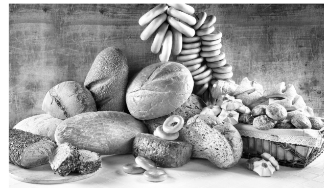
Композиция «Продукция сысертского хлебокомбината»