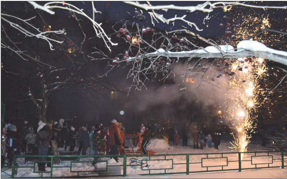
А завершился праздник двора на Карла Маркса, 63, ярким фейерверком