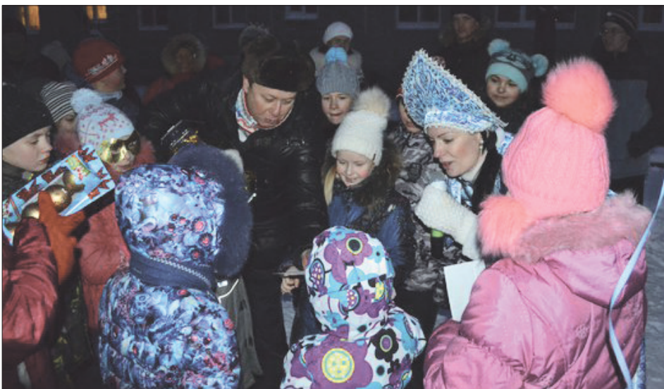
Депутат Максим Серебренников вручает победительнице билет в филармонию

В выходной день, 26 декабря, под задорную новогоднюю музыку из своих квартир выходили жители дома 35 на улице Орджоникидзе. Дети идти за руку отказывались и бежали впереди родителей к новогодней елке, которая красовалась посреди двора, ведь совсем скоро здесь окажутся долгожданные гости – Дед Мороз и Снегурочка!