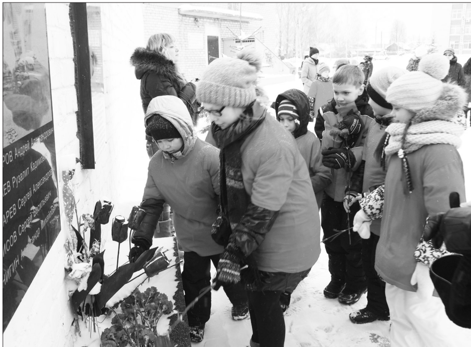
Школьники возлагают цветы к памятной доске погибшим в Афганистане и Чечне сысертчанам

За время войны в Афганистане в составе ограниченного контингента советских войск побывало 620 тысяч военнослужащих.