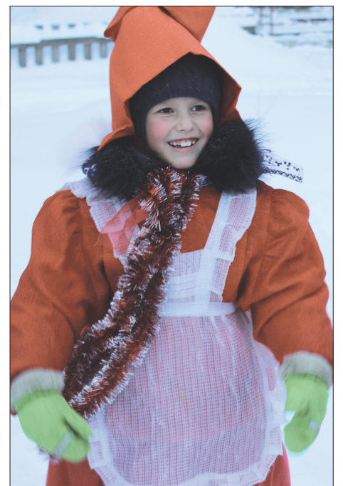
Красная Шапочка с ул. Орджоникидзе